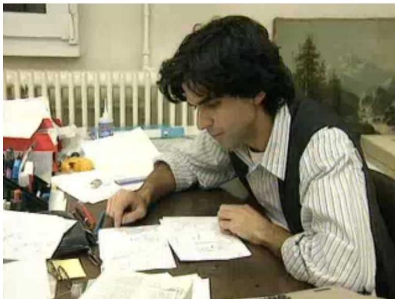
Патрик Шаппатт за работой

...В 1965 году, по поводу полувекового юбилея французской сатирической газеты «Le Canard enchaîné», журналисты RTS побеседовали с ее карикатуристами. Главное лицо программы – автор рисунков Ролан Муазан . Карикатуры Муазана на Шарля де Голля и его политические шаги выходили на страницах издания каждую неделю. На вопрос об этих рисунках автор ответил, что не считает себя бестактным по отношению к оригиналу, и добавил, что де Голль, который наверняка видит карикатуры в газете, вряд ли остается недоволен, «ведь я часто изображаю его королем».