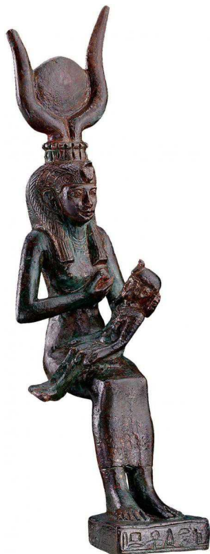
Исида, кормящая Гора

Экспонаты расположены по оригинальному принципу «противоположности сходятся». Здесь седая старина соседствует с последними достижениями нашей цивилизации. Посетителю легко проследить, как менялись гастрономические стереотипы с течением веков. Перед зеркалом прихорашивается худенькая Барби в розовом платье, а рядом с ней красуются статуэтки пышнотелых античных богинь. В отличие от современных идеалов «худосочной красоты», культивируемых западными средствами массовой информации, в древности полнота символизировала изобилие, богатство, здоровье, благословение небес. Богинь изображали в виде дородных женщин. Толстощекий ребенок вызывал радость родителей. Обильная еда, так же, как и доброе вино, веселит душу и радует сердце, считали древние. Поистине: скажи мне, как ты ешь, и я скажу, кто ты!