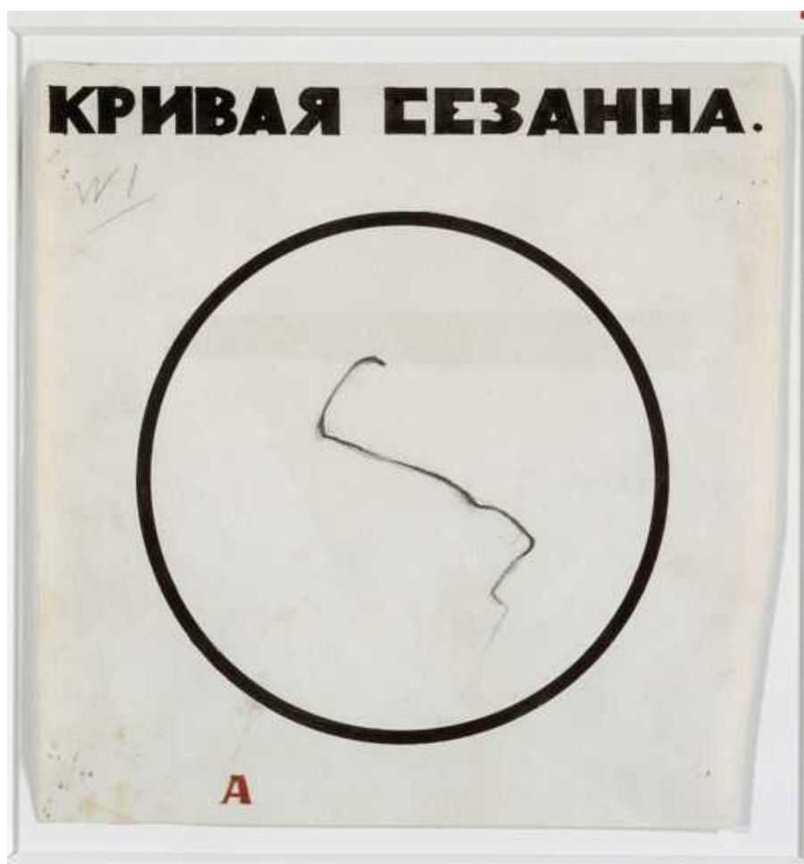
Казимир Малевич. Кривая Сезанна. 1927 (Kunstmuseum Basel)

Малевич был избран в совет профессионального Союза художников-живописцев в Москве представителем от левой федерации (молодой фракции). В августе он становится председателем Художественной секции Московского совета солдатских