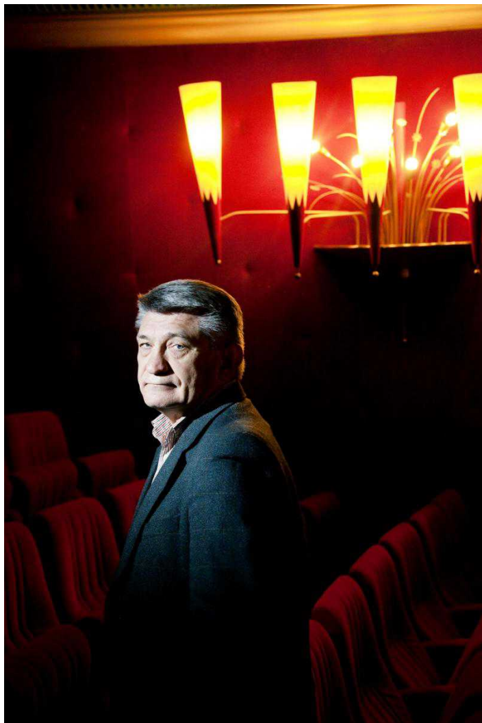
Александр Сокуров в Лозанне Что самое трудное при проведении подобных фестивалей?

Небрежно подготовленные фестивали только вредят. Отбор фильмов – крайне сложный и ответственный процесс. И порой вокруг ничего не значащих произведений вдруг начинают вестись глубокомысленные разговоры. Надо четко разделять кино как визуальный товар и кино как произведение искусства. Любительским образом составленные программы только мешают восприятию национальной культуры.