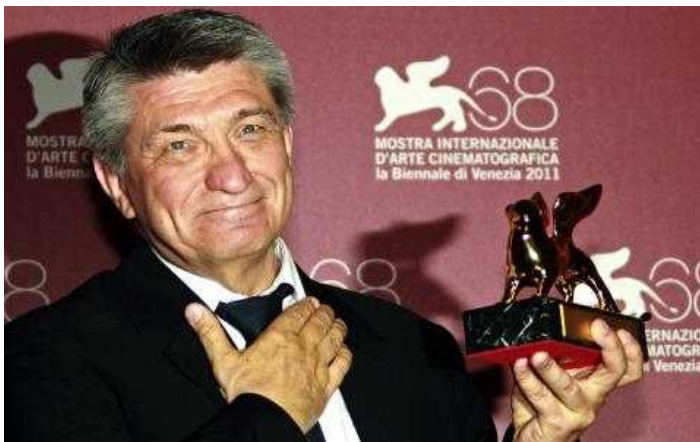
Александр Сокуров на Венецианском кинофестивале

Только настоящие художники могут заглянуть в будущее и вернуться. Это возможно только в области искусства. При этом все – от Толстого и Данте до Боккаччо и Манна – показывают нам что-то положительное, дают надежду, утверждают жизнь. Научно-технический прогресс направлен на некую конечную точку.