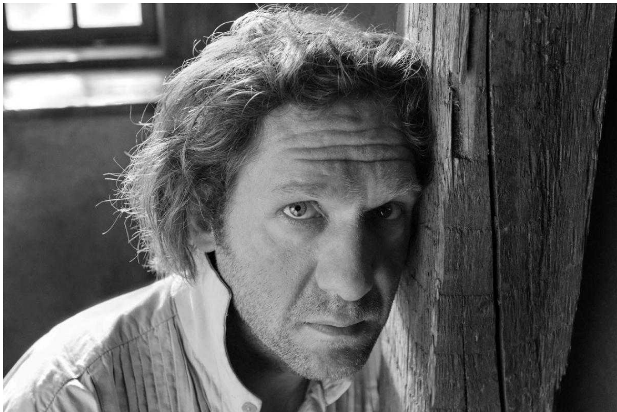
Кадр из "Фауста"