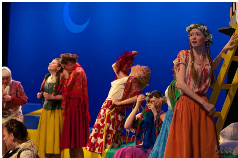
Сцена из спектакля "Бабий бунт"

Открытие фестиваля состоялось 26 апреля на сцене театра Cité Bleu. Главным событием вечера стало выступление выпускников Театрального института им. Б.В. Шукина, которые привезли в Женеву один из своих спектаклей – «Бабий бунт», построенный по мотивам рассказов Шолохова. Несмотря на свой молодой возраст (выступление в Женеве стало 23-м), спектакль с успехом идет в Москве.