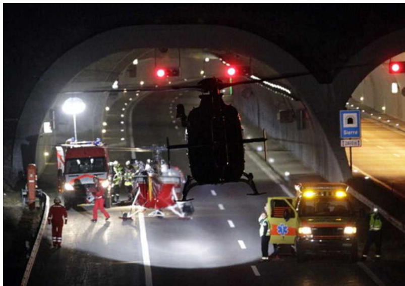
Спасательные работы в тоннеле

Спасательные работы шли всю ночь. За детские жизни с первых минут после катастрофы боролись более двухсот человек: 15 врачей, 30 полицейских, 60 пожарных, 100 санитаров и три психолога, были задействованы 12 машин скорой помощи и 8 вертолетов.