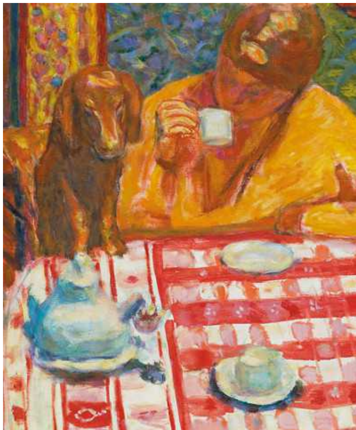
Кафе. Фрагмент. Пьер Боннар. 1915 Боннар и «Наби».

Довольно скоро Боннар перерос своих учителей и стал самостоятельным и признанным художником. В конце 1880-х он входит в состав художественно-артистической группы «Наби», основанной учеником Гогена французским художником Полем Серюзье (1864-1927). В ее состав входил и Феликс Валлотон, чьи работы выставлены на экспозиции в Лозанне в Fondation de l'Hermitage. Группа просуществовала только до 1905 года. Однако за этот короткий период художникам удалось выработать свой собственный легко узнаваемый стиль. Неважно, окажетесь ли вы в Пушкинском музее в Москве, в музее Орсе в Париже или в лондонской Тейт Модерн, вы безошибочно угадаете работы художников из «Наби». Название группы происходит от древнееврейского слова «нави», что значит «вестник», «пророк». Такое обозначение придумал поэт Анри Казалис, который углядел в группе художников-единомышленников черты, роднящие их с древними пророками народа израилева: «большинство носило бороды, некоторые были евреями, и все были до невозможности серьезны». Несмотря на такое описание, их работы отличает насыщенность яркими тонами и легкость, за которой скрывается философская концепция. Художники особенно увлекались религиозно-мистическими мотивами, с одной стороны, и интимно-лирическими сюжетами, с другой.