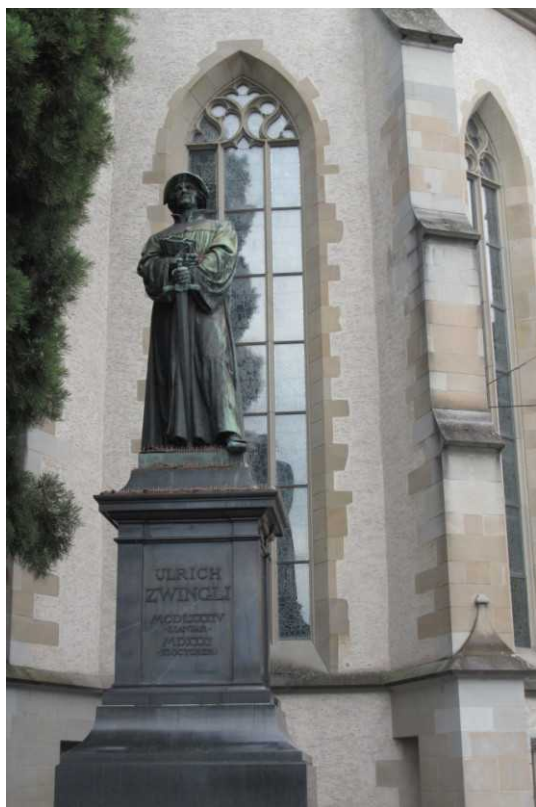
Памятник Цвингли в Цюрихе

именем Турикум, неприступный форпост охранял римские территории от германских нашествий. В 1218 году Цюрих стал свободным городом, а в 1351 году – вошел в Швейцарскую Конфедерацию.