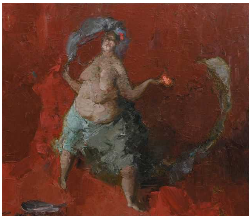
"Саломея", масло, холст, 75х65

«Руина» и сама по себе весьма притягательное место, со своим дружественным свободному художнику микроклиматом. Например, эта галерея обладает особым свойством снова сводить потерявших было друг друга старых друзей и знакомить в своих стенах близких по духу незнакомцев среди