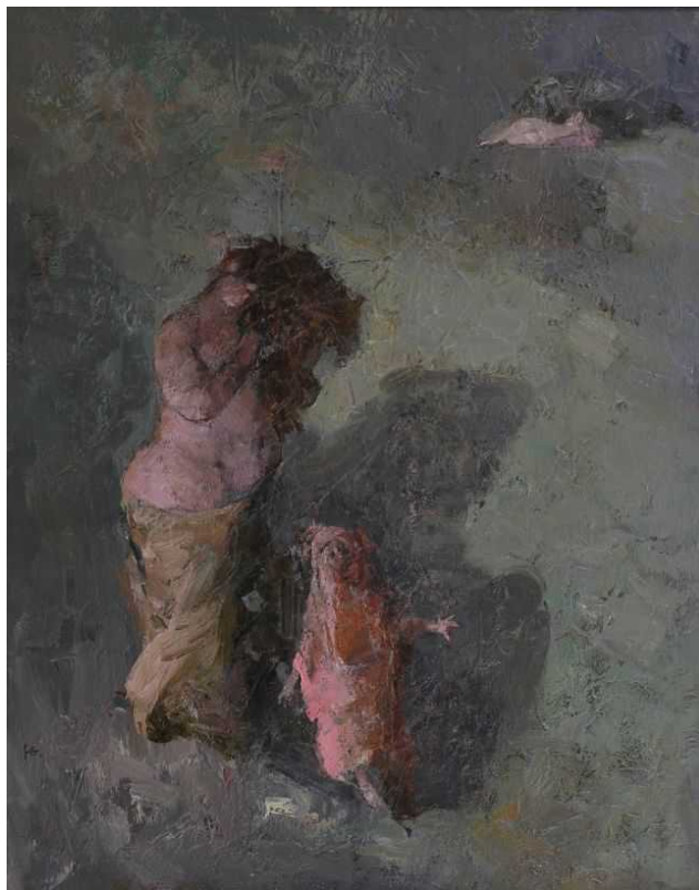
"Купальщики", масло, холст, 55x77 см