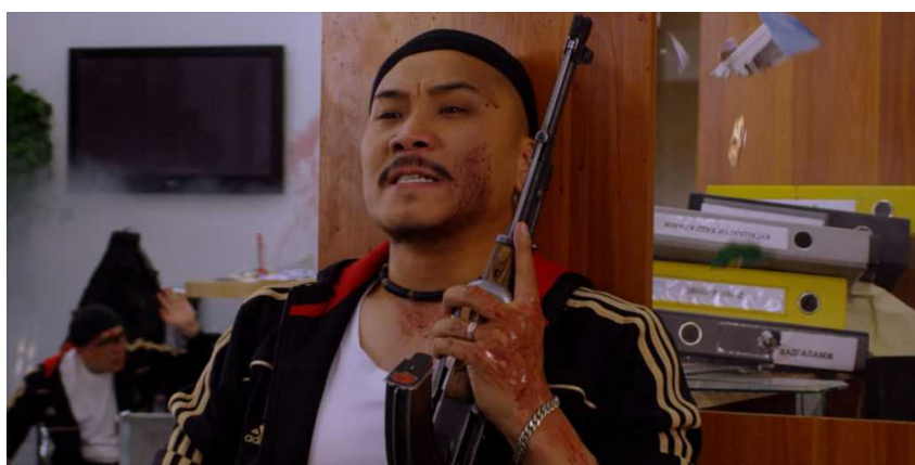
"Операция Татар" (niff.ch)

Отдельной частью программы станет собрание лучших короткометражных мультфильмов российских и восточноевропейских режиссеров, которая будет показана 2 и 6 июля.