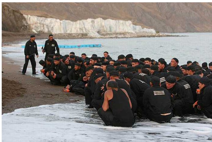
"Новая земля"