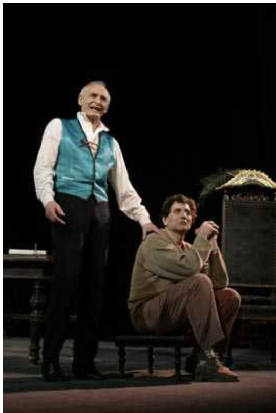
Василий Лановой и Евгений Князев

На острове он обрел спасение от повседневности: здесь не надо играть счастливого человека, «надевать» светскую улыбку, когда к горлу подступает боль и страдание. Однако его уединение неожиданно нарушает Эрик Ларсен, представившийся журналистом.