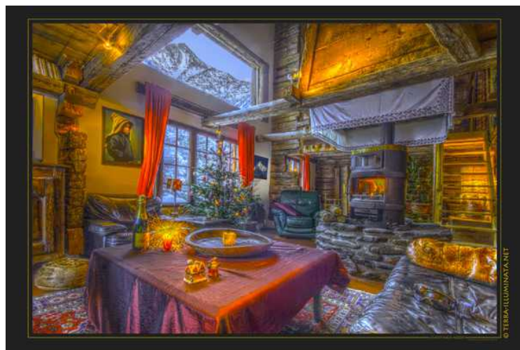
"Рождественское настроение"