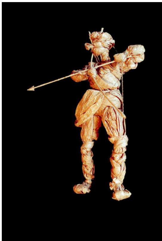
Древний охотник

Однако юная аудитория быстро разобралась, кто есть кто в этой древней истории, и