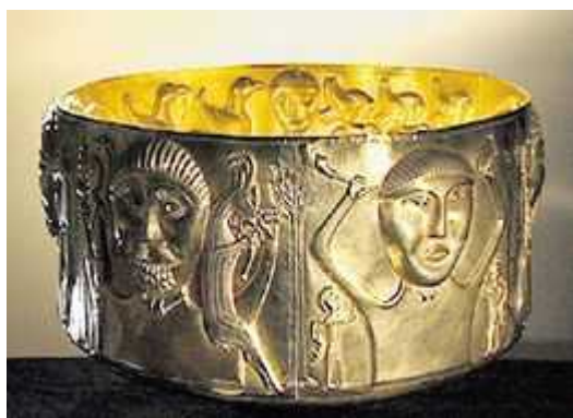
Загадочный сосуд из Химзее (© Keystone)

Автор: Иван Холмский, Цюрих , 02.11.2010.