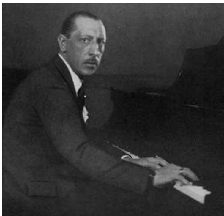
Игорь Стравинский (1882-1971)