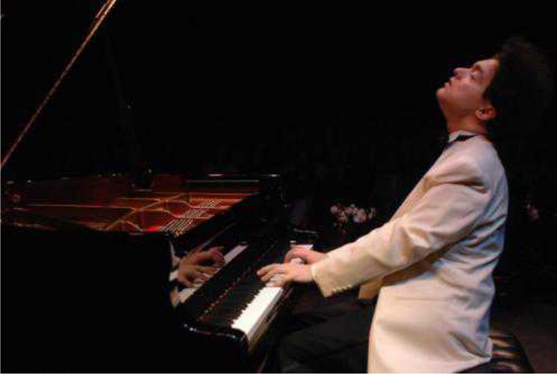
Играет Евгений Кисин

Поднимаясь на поезде из Мартины в Шабль, а затем на подъемнике в Вербье, забавно было смотреть, как поднимался по серпантину рекламный кортеж, разбрасывая фирменные кепки и прочую ерунду.