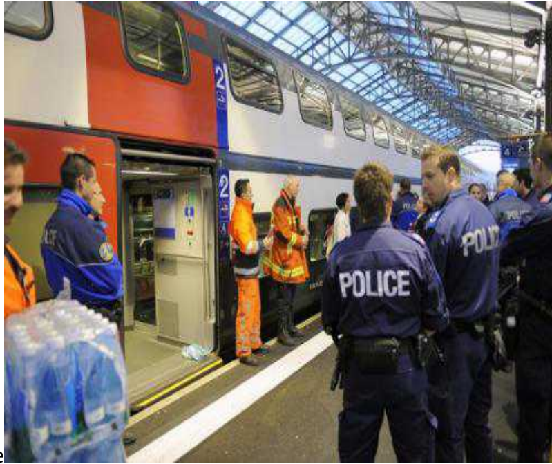
Инцидент в поезде

В понедельник 27 апреля в 17 часов 50 мин. контейнер с образцами вируса – единственными в Швейцарии! - свиного гриппа, взорвался в поезде, направлявшемся в Женеву. Поезд был остановлен при въезде на вокзал Лозанны, хотя взрыв произошел около Фрибурга. Около 60 пассажиров были еще некоторое время блокированы в вагонах, пока не выяснилось, что образец гриппа не опасен для человека.