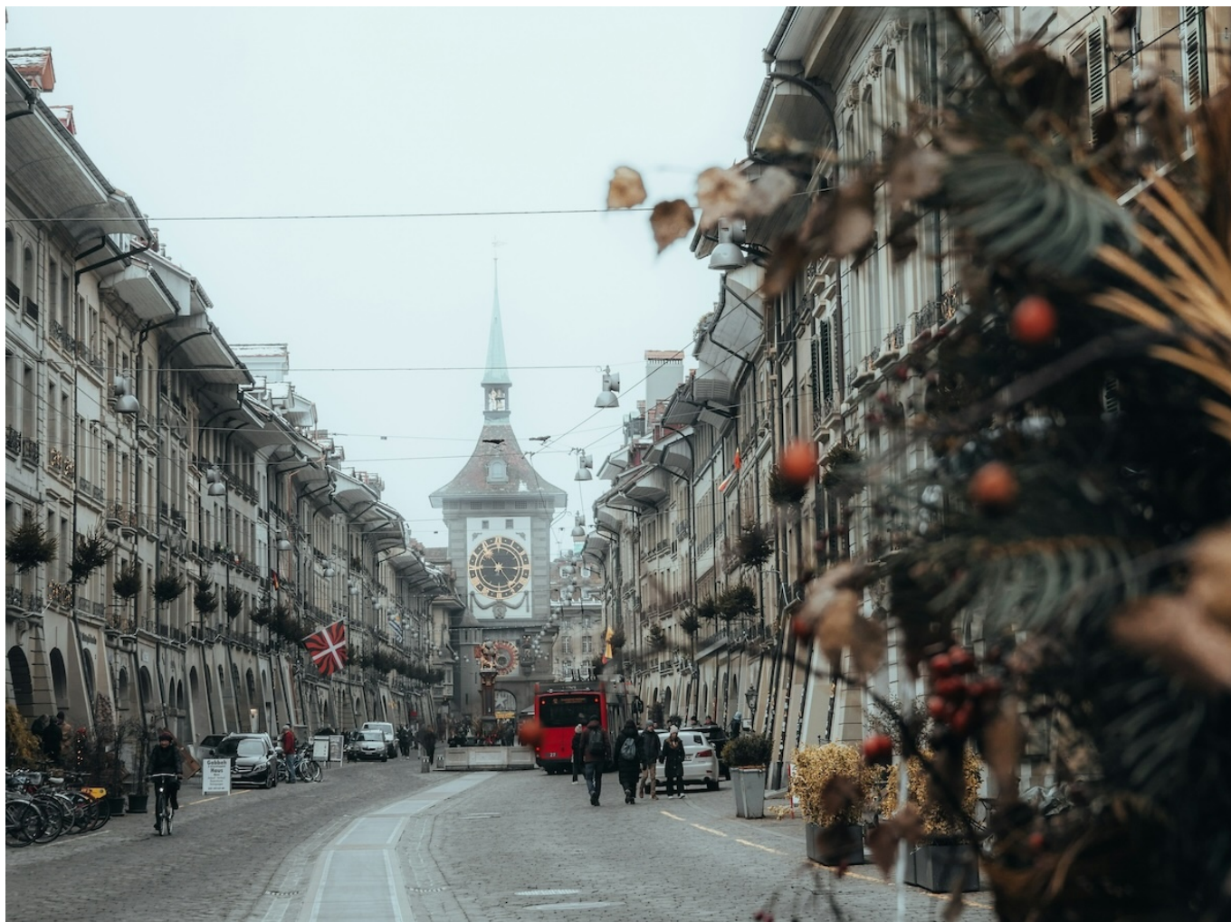
Фото: Febe Vanermen, Unsplash

Auteur: Зарина Салимова, Берн , 24.12.2025.