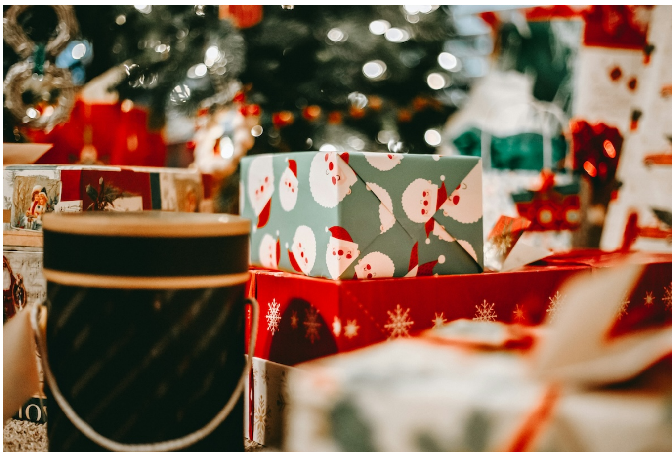
Фото: Isaac Martin, Unsplash

Auteur: Заррина Салимова, Берн , 09.12.2025.