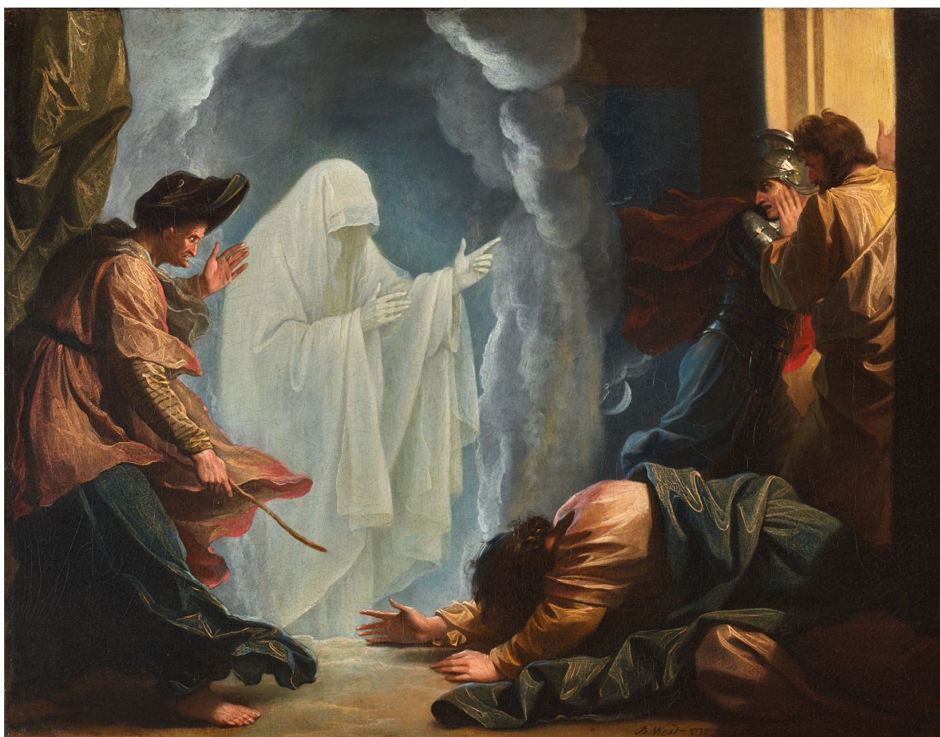
Бенджамин Уэст. Царь Саул и Аэндорская волшебница, 1777 г.

Auteur: Ника Пархомовская, Базель , 03.10.2025.