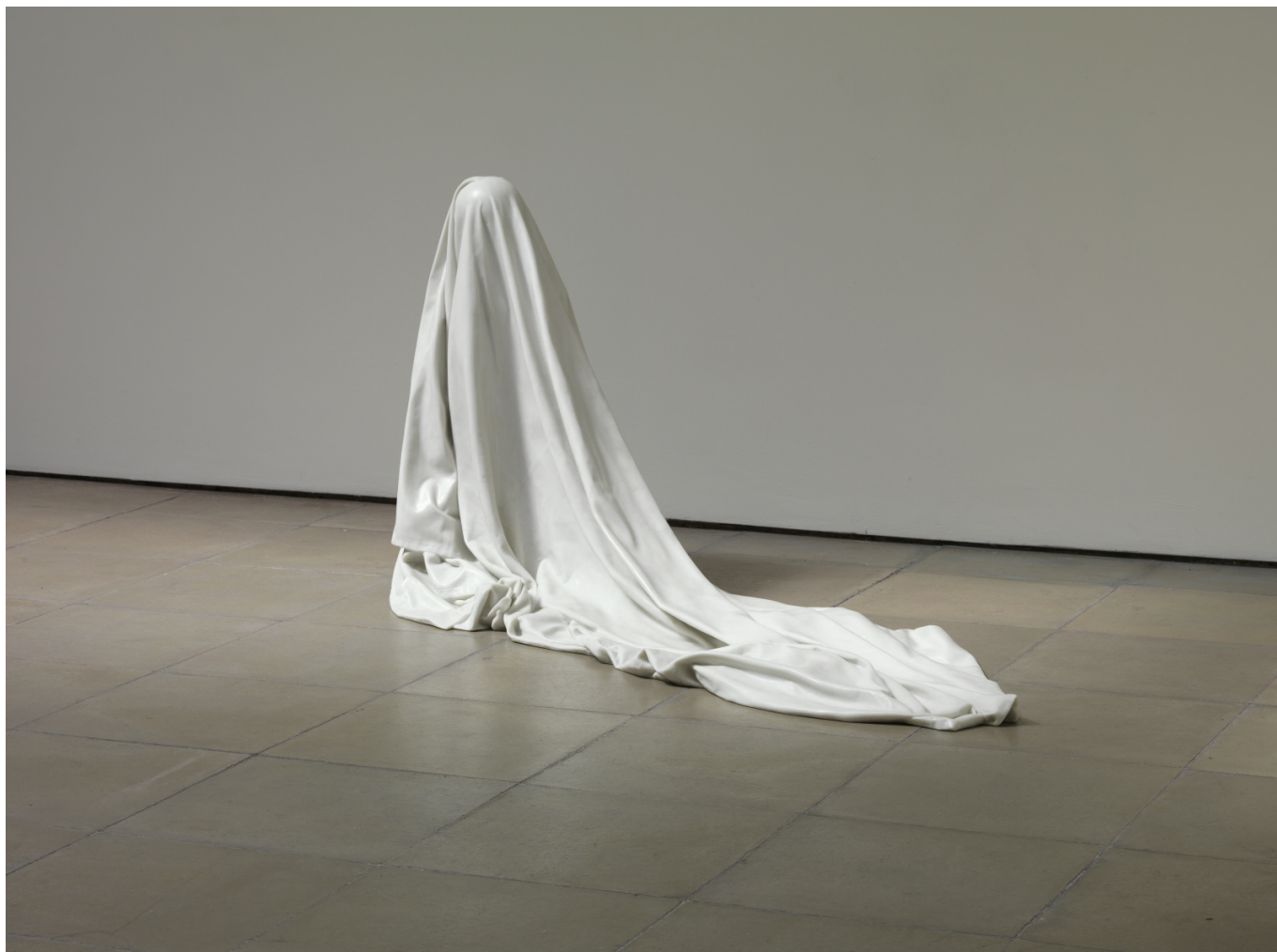
Райан Гандер. Скажите маме, чтобы не волновалась: 2012 г. Collection privée ; Anish Kapoor, Londres