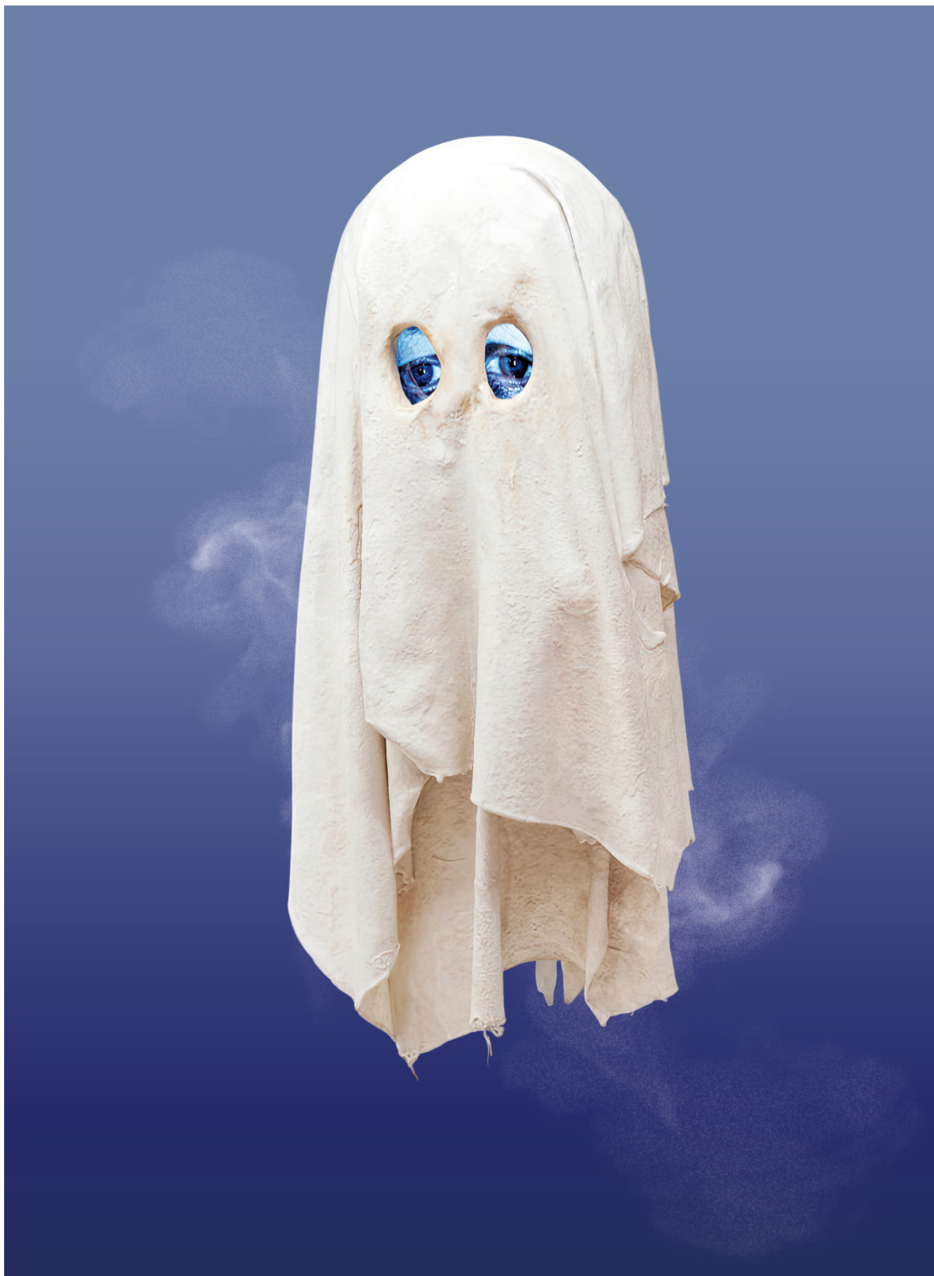
Тони Урслер. Fantasmino, 2017 г.

Разумеется, неразумно требовать собрать в одной – пусть и довольно пространной –