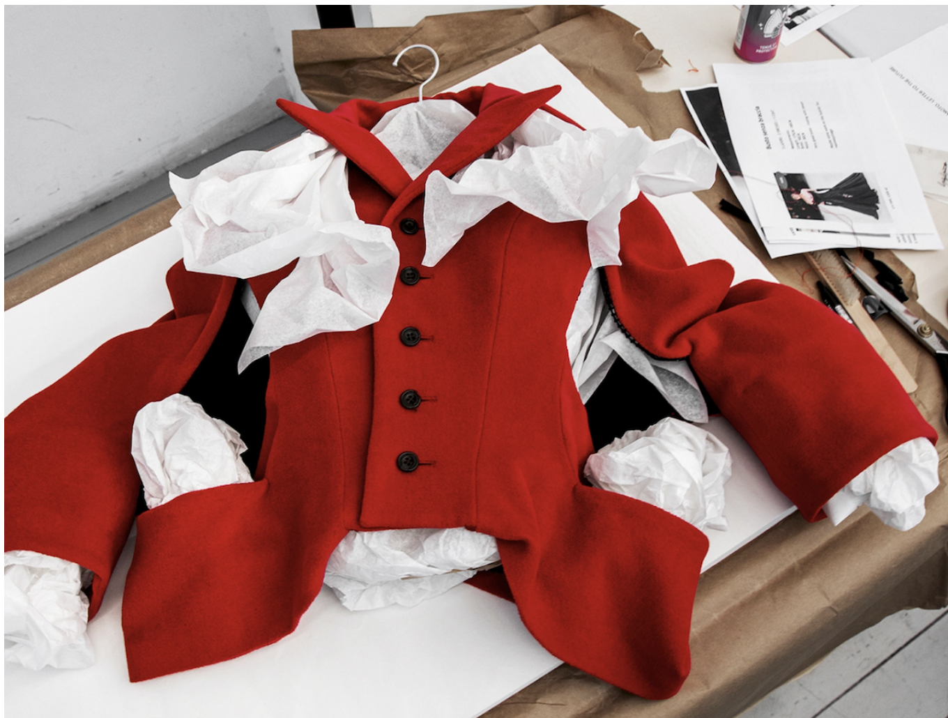
Проект Preparatory.