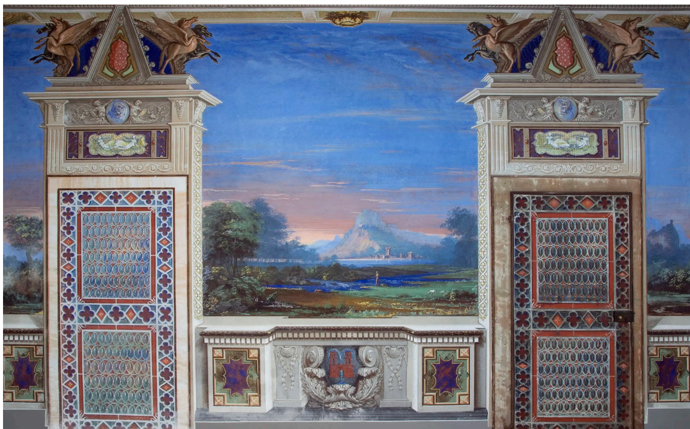
Ронко-сопра-Анкона