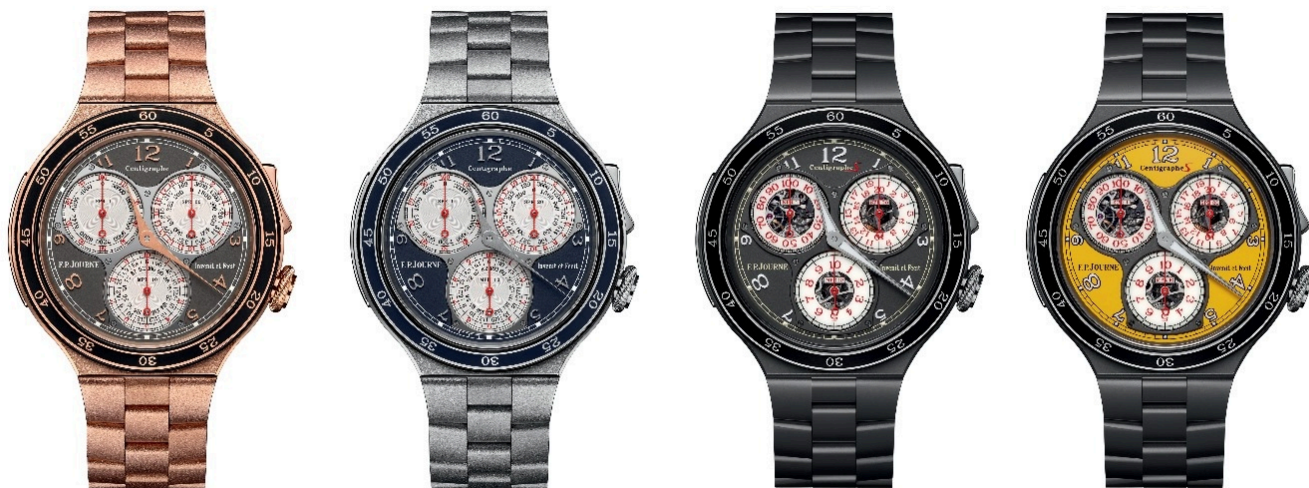
Модель Centigraphe.

важен, так как треть финансирования исследовательского центра поступает от частных благотворителей. В дополнение к существующим инициативам F.P.Journe и Институт мозга объявили о новом партнерстве, направленном на поддержку подразделения исследований и разработок, которое теперь называется F.P.Journe RnD Unit. Благодаря этому отдел сможет удовлетворить растущие потребности исследователей, клиницистов и стартапов. В условиях старения населения заболевания мозга скоро будут затрагивать каждого восьмого человека в мире, поэтому стремление вылечить эти заболевания совершенно понятно.