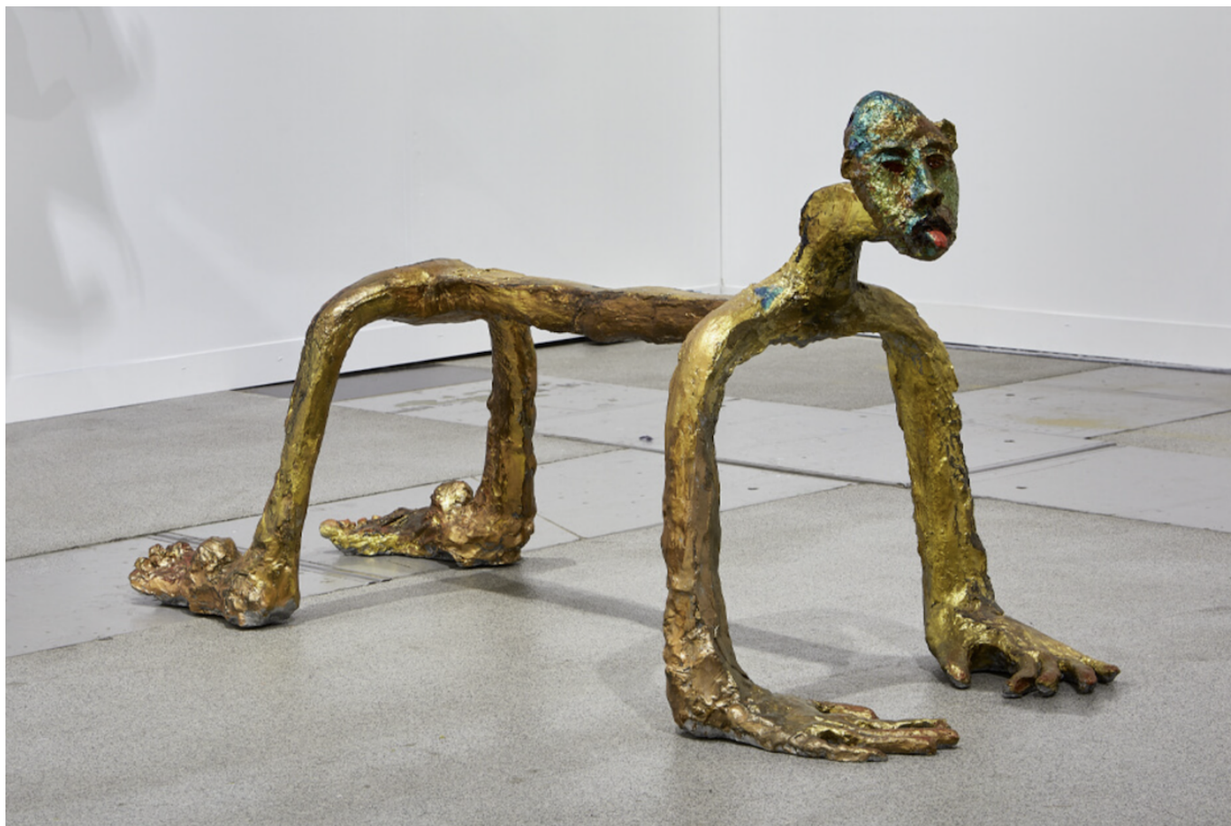
Скульптура Анны Богигян

Auteur: Зарина Салимова, Женева-Париж-Монте-Карло , 11.07.2024.