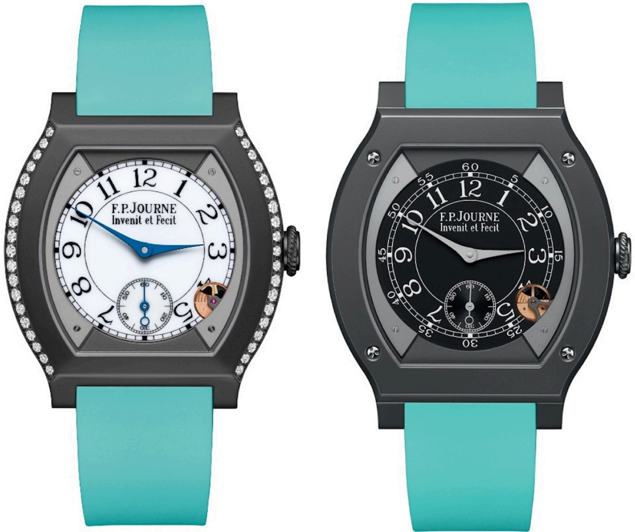
Часы Titalyt® 40 мм и Titalyt® 48 мм из коллекции élégante от F.P.Journe

Для создания инновационного механизма этих часов понадобилось восемь лет разработок: élégante может останавливать время и запускать его снова! Часы имеют механический датчик движения. После 35 минут без движения они переходят в режим ожидания для экономии энергии: микропроцессор продолжает измерять время, но механические элементы, такие как зубчатая передача, роторы и стрелки, перестают двигаться. Затем, когда человек снова надевает часы, они автоматически устанавливают текущее время, а стрелки переводятся по кратчайшему пути – как по часовой стрелке, так и против нее. Часы могут определять время до 18 лет в режиме ожидания.