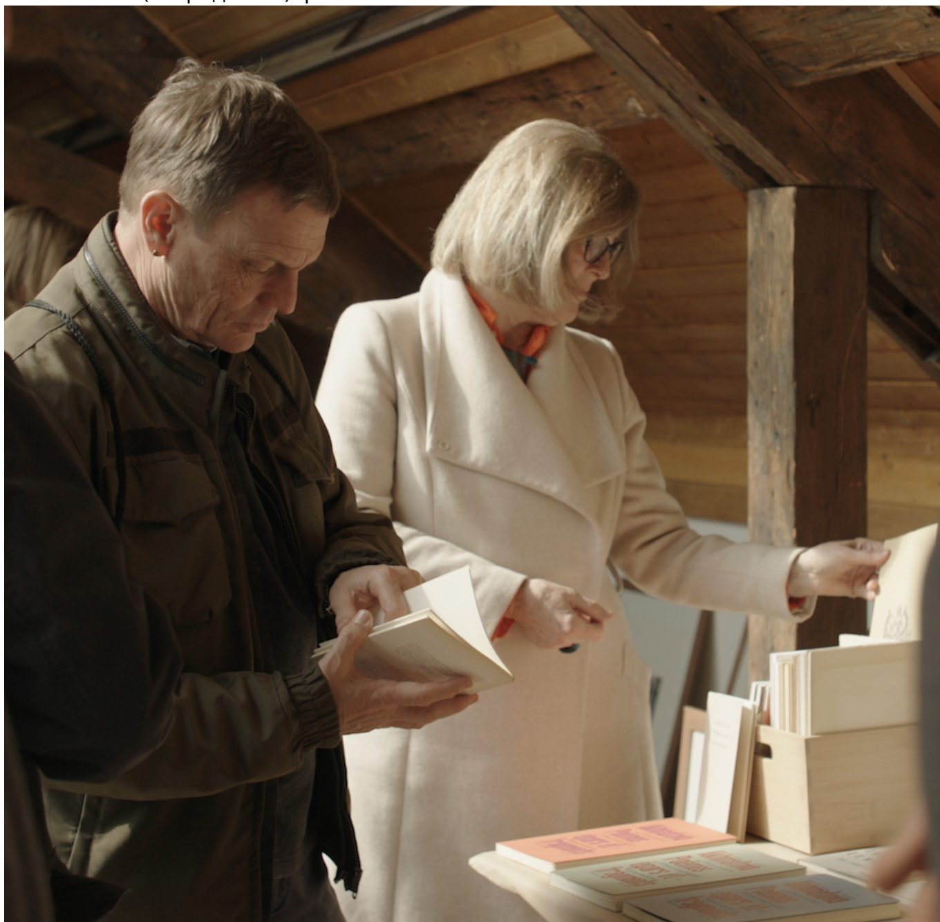
На открытии Дома поэзии

лишь как дисциплинарный трансфер и профессиональное смещение, ретроспективно будет осознано как некие рефлексорные биографические действия в преддверии «активной фазы войны и эмиграции», в точности совпадающие по периодизации с их пассивными (гибридными) фазами.