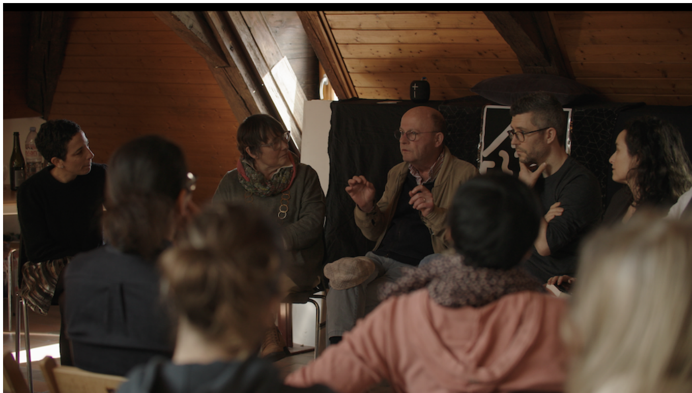
На открытии Дома поэзии

23 марта на чердаке старой тюрьмы Веве, совсем неподалеку от другой прославленной поэтической тюрьмы – Шильонского замка, открылся Швейцарский дом поэзии . По случаю открытия состоялась дискуссия «Действительно ли мы делаем то, что нам нужно?». Эти слова швейцарский классик Роберт Вальзер сказал своей сестре перед тем, как отправиться в пенитенциарное учреждение немного иного типа – психиатрическую клинику, где он и проведет остаток своих дней. Здесь, в романдской Швейцарии вообще, по-моему, принято проводить «остаток своих дней»: затравленный в охоту на ведьм Чаплин (Веве), расположившийся в крыле отеля Набоков (Монтре), наконец, недавно отписавшийся Годар (тоже в кантоне Во).