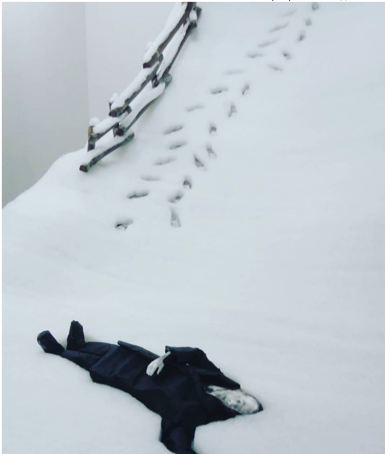
Фото экспозиции из музея Р. Вальзера в Берне

даже дописать ни один из своих фрагментов, складывает без особого порядка неоконченные или даже принципиально неоканчиваемые фрагменты в некую коробку, по пути к издателю они закономерно и безвозвратно теряются, а он сам замерзает в снегу неподалеку от психиатрической лечебницы... и все же обо всей этой неосновательной жизни письма мы оказываемся прекрасно осведомлены.