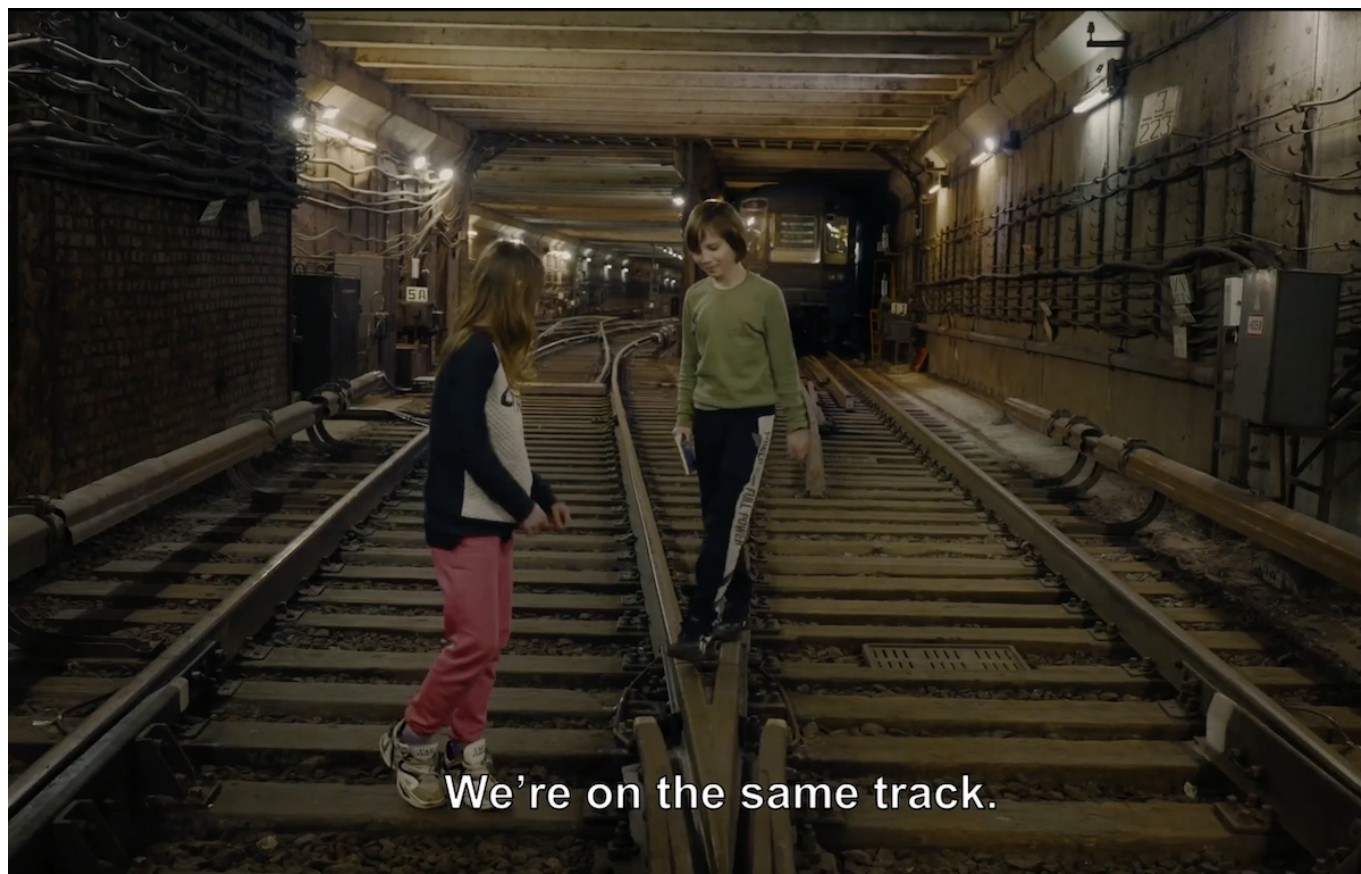
Кадр из фильма «Фотофобия»

Фильм « 1489 » – это личная история режиссера Шогакат Варданян, потерявшей брата во время второй карабахской войны в 2020 году. Молодой Согомон пропал без вести через неделю после того, как его призвали в армию, а вынесенный в название ленты номер – это условное обозначение его останков. Фильм, удостоенный награды на Международном фестивале документального кино в Амстердаме IDFA 2023, напоминает нам о том, что за цифрами потерь и данных о численности личного состава стоят люди из плоти и крови. Показы картины состоятся 12 и 16 марта (с последующей дискуссией «Нагорный Карабах: забытая судьба»). Фильм содержит кадры, которые могут шокировать.