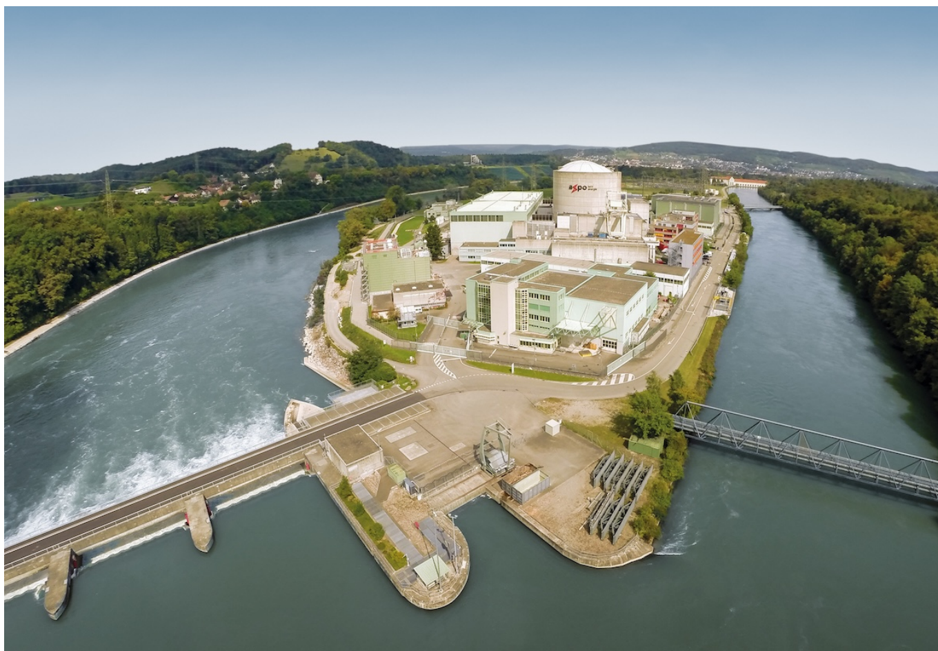
АЭС в Бецнау

Auteur: Заррина Салимова, Берн , 23.01.2024.