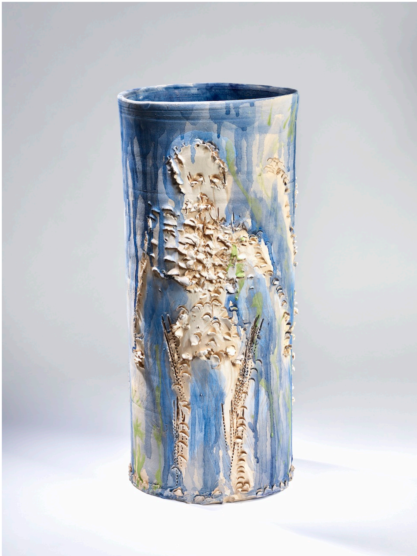
Мигель Барсело, Без названия, 2022

Интересно, что скарификация не ведаёт гендерных различий и наблюдается как у мужчин, так и у женщин, причем на любых частях тела: лице, груди, спине, плечах,