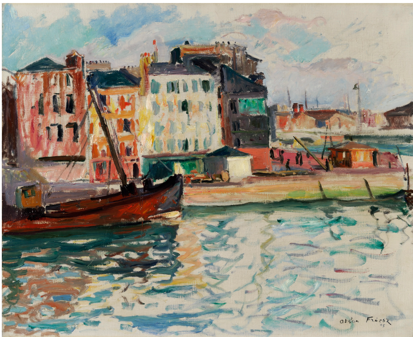
Эмиль Отон Фриез. Порт в Онфлёре, 1905 г. Collection privée © Dr.

Auteur: Надежда Сикорская, , 07.07.2023.