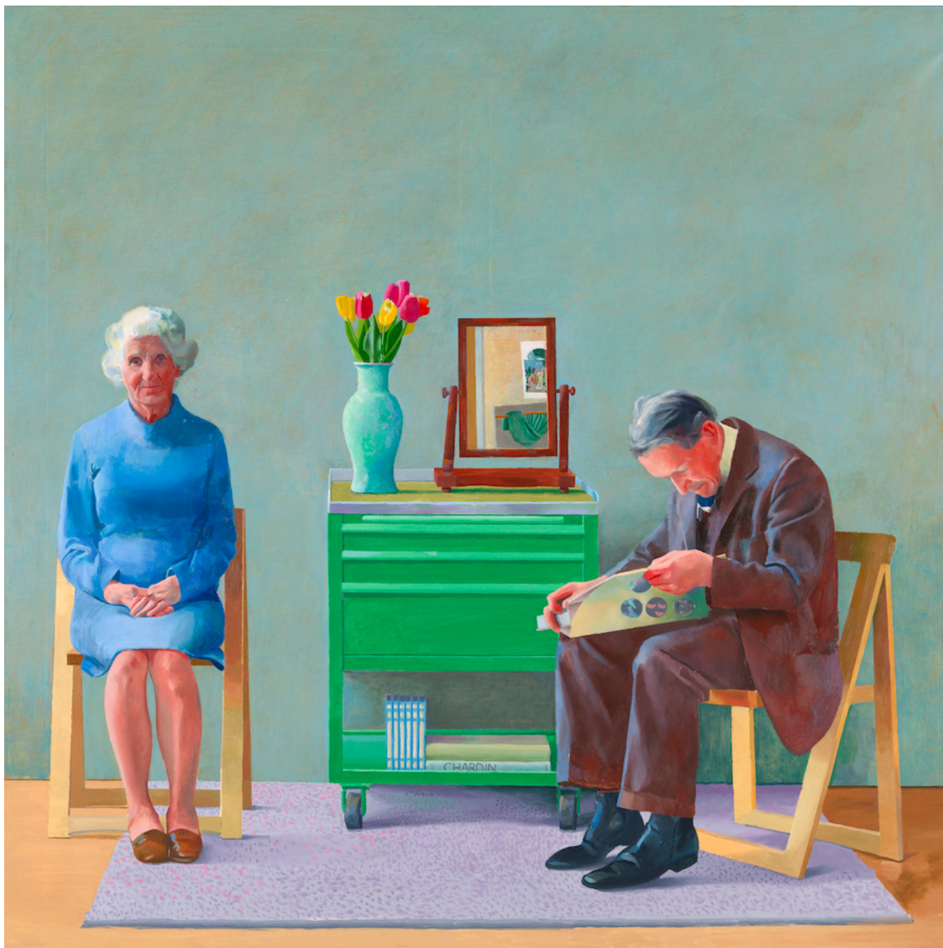
Дэвид Хокни. Мои родители, 1977 г. Тейт: приобретено в 1981 году

В одном из последних залов выставлена монументальная работа «Большие деревья у воды». В течение нескольких недель художник ездил между студией и лесом, работая одновременно над несколькими фрагментами полотна. Чтобы сохранить общую композицию, Дэвид Хокни компоновал изображения на компьютере. В результате получилась гигантская картина, состоящая из 50 видов весеннего Йоркшира и имеющая в длину 12 метров. Другую стену занимает еще один монументальный пейзаж с тропинкой, выющейся между деревьев с разноцветными листьями, ветвями и стволами. Обязательно присядьте отдохнуть на скамейке в центре зала между этими двумя картинами, всмотритесь в пейзаж и попытайтесь мысленно прогуляться по этому сказочному лесу и услышать шелест листьев на ветру.