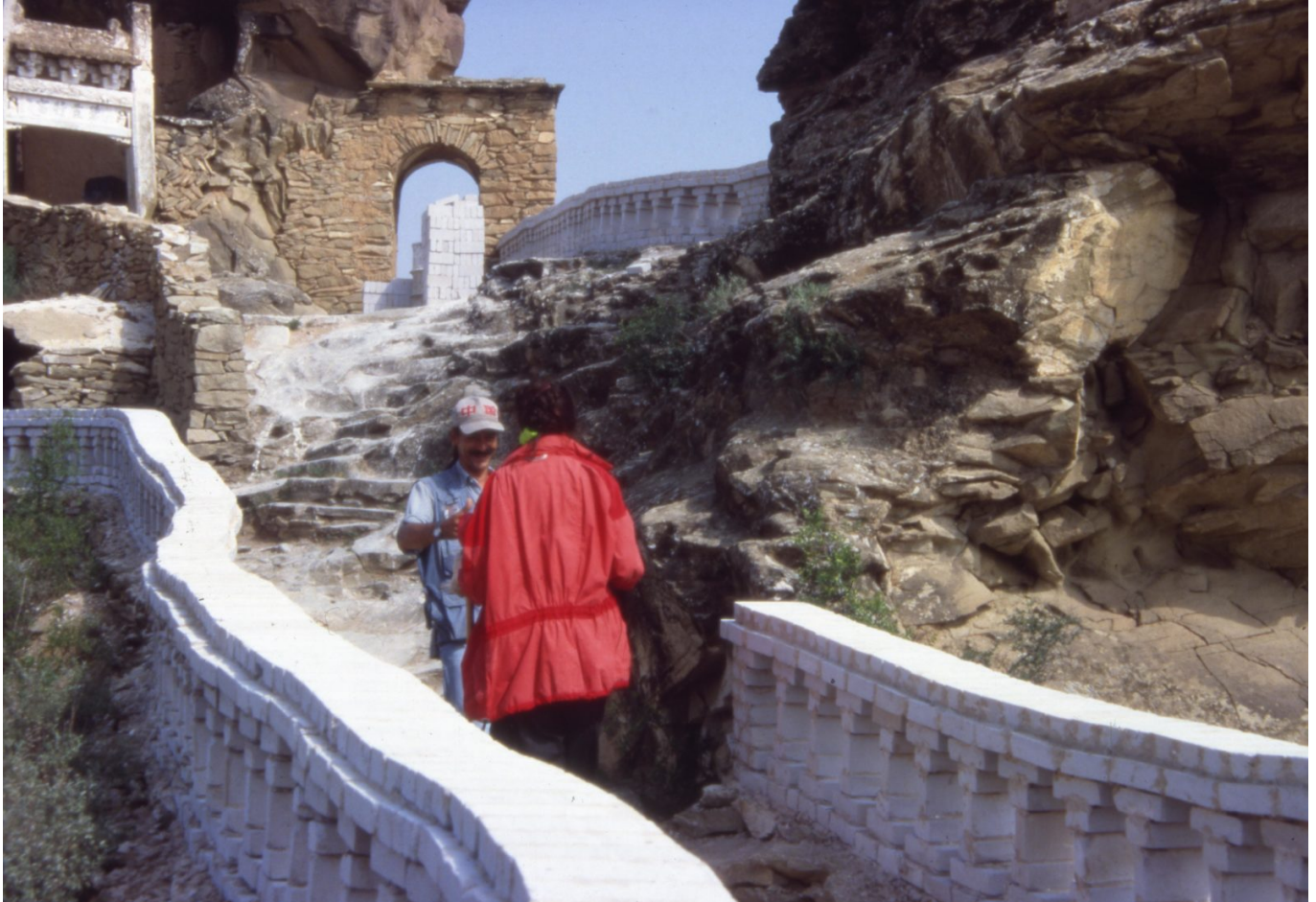
Встреча Марины Абрамович и Улая на Великой Китайской стене, 1988 г.

Два года назад Наша Газета рассказывала о сделанной в 1981 году серии полароидных фотографий в четырех частях Modus Vivendi Марины Абрамович и Улая, которая была выставлена в Художественном музее Берна. Работа, которую теперь увидят посетители Images Vevey, занимает особое место в творчестве обоих художников. Марина и немецкий художник-концептуалист и перформансист Улай познакомились в 1976 году в Амстердаме и быстро поняли, что их объединяет идея «коллективного существа», которое они сами называли как «Другое».