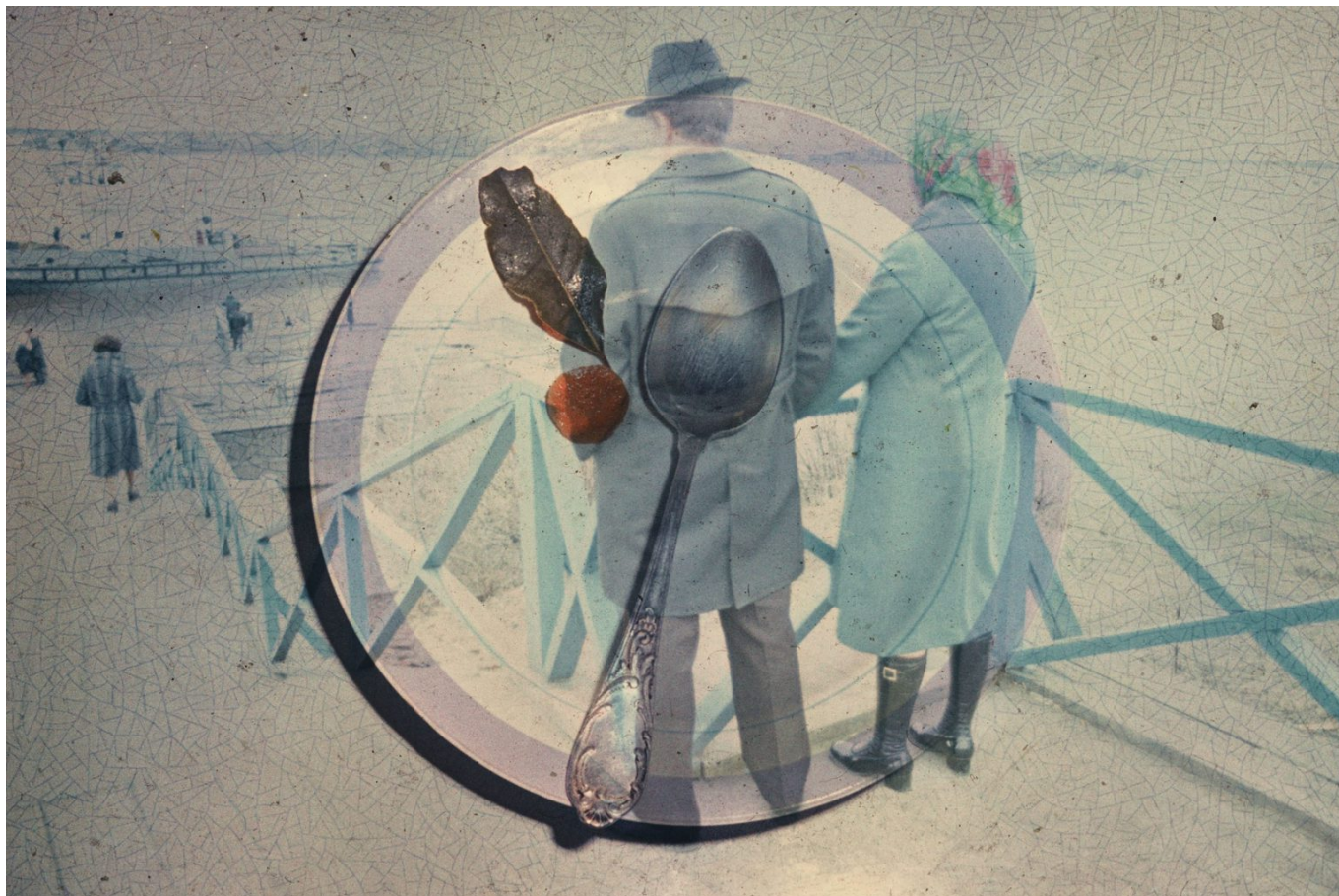
Борис Михайлов. "Вчерашний сэндвич"