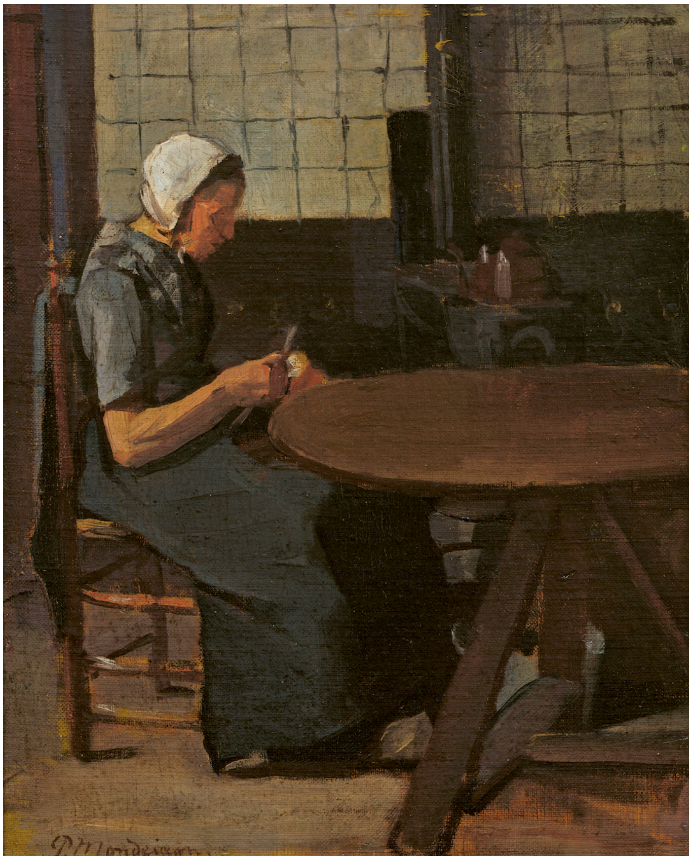
Пит Мондриан. Женщина с веретеном, ок. 1893-1896 гг.

В начале 1910-х годов Мондриан увлекся цветом. На его полотне «Красное облако» 1907 года запечатлен волшебный момент, когда заходящее солнце окрашивает облако в ярко-красный цвет, в то время как небо остается ярко-синим. Эта картина принадлежит к группе работ, которые Мондриан писал в сумерках, когда оттенки быстро меняются. На автопортретах 1908 года он также изображает себя в сумерках