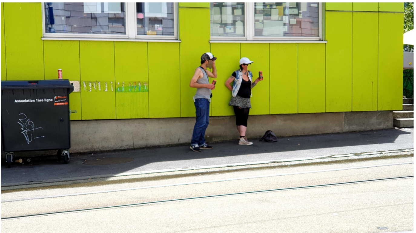
Будний день. Маргиналы челят.

Там было очень интересно уже до начала занятий. Интересно, но непонятно. Сложное расписание, голубые, зеленые, оранжевые комнаты, мастер-классы, театры, разговорный клуб, outdoor активности. Я попросил консультацию у преподавателя на английском, но тот говорил только на испанском или французском. И это было логично: в тот день среди 16 учеников было 14 колумбийцев, ваш покорный слуга из Украины и Татьяна (имя изменено) из Молдовы, лет пятидесяти. Она и пришла мне на выручку.