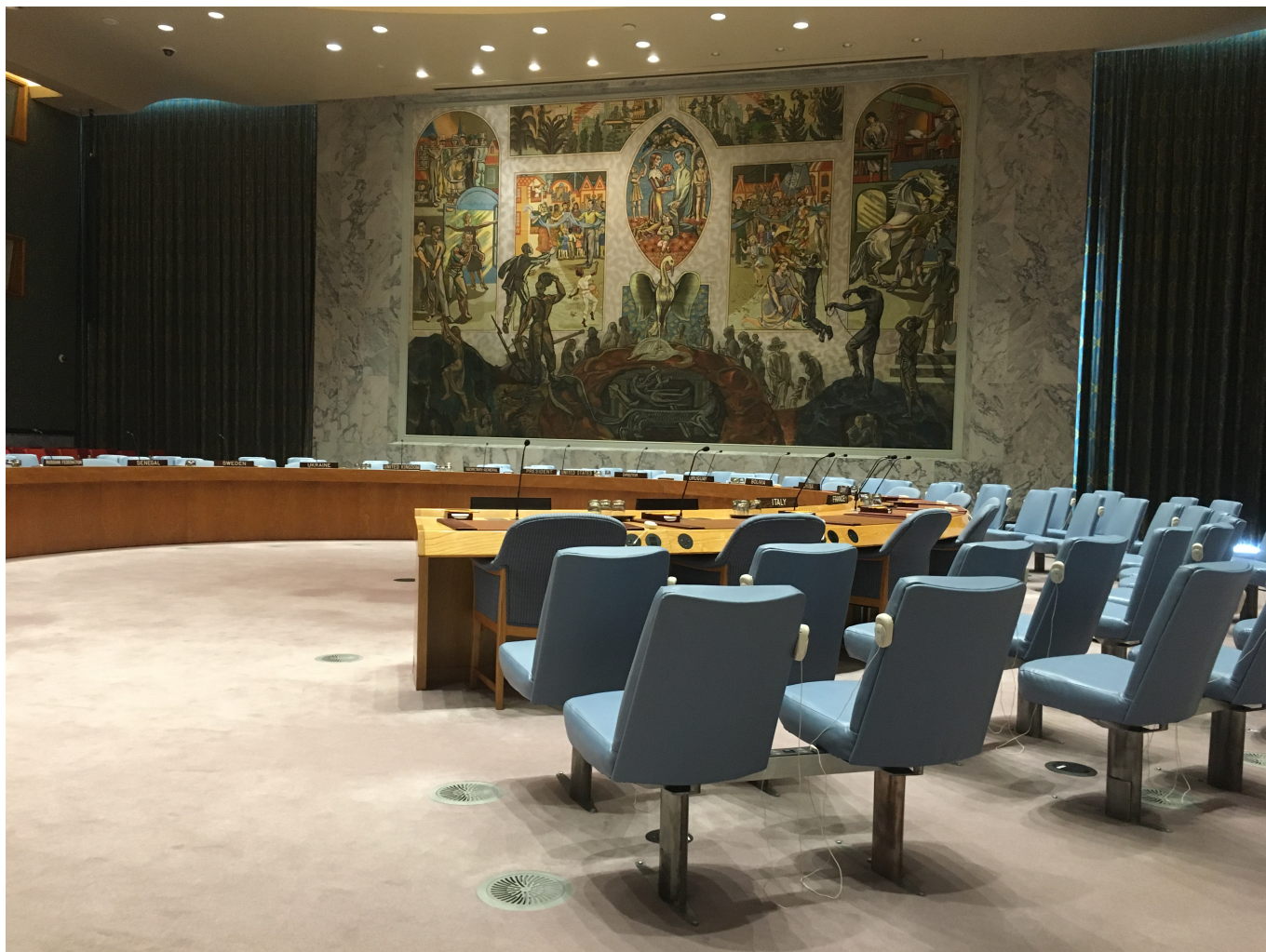
Зал заседаний Совета Безопасности ООН в Нью-Йорке

Auteur: Надежда Сикорская, Берн , 10.06.2022.