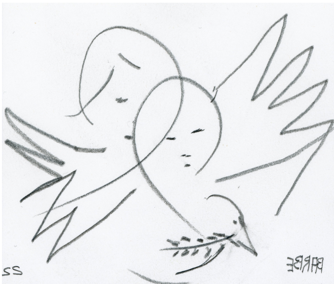
Рисунок художника Паскаля Барба послужил афишей предстоящего вечера

Auteur: Надежда Сикорская, Женева , 03.06.2022.