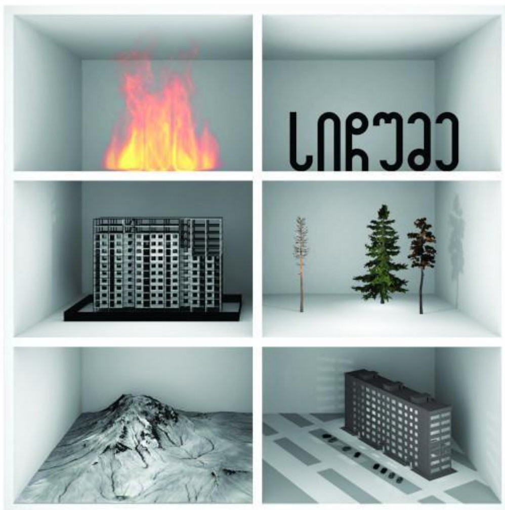
Грузинский павильон.

Павильон Казахстана превращен в полномасштабный исследовательский центр, основанный на идеях художника, изобретателя, писателя и «городского сумасшедшего» Сергея Калмыкова, который умер в полной неизвестности в Алматы в 1967 году, но вдохновил несколько поколений современных художников.