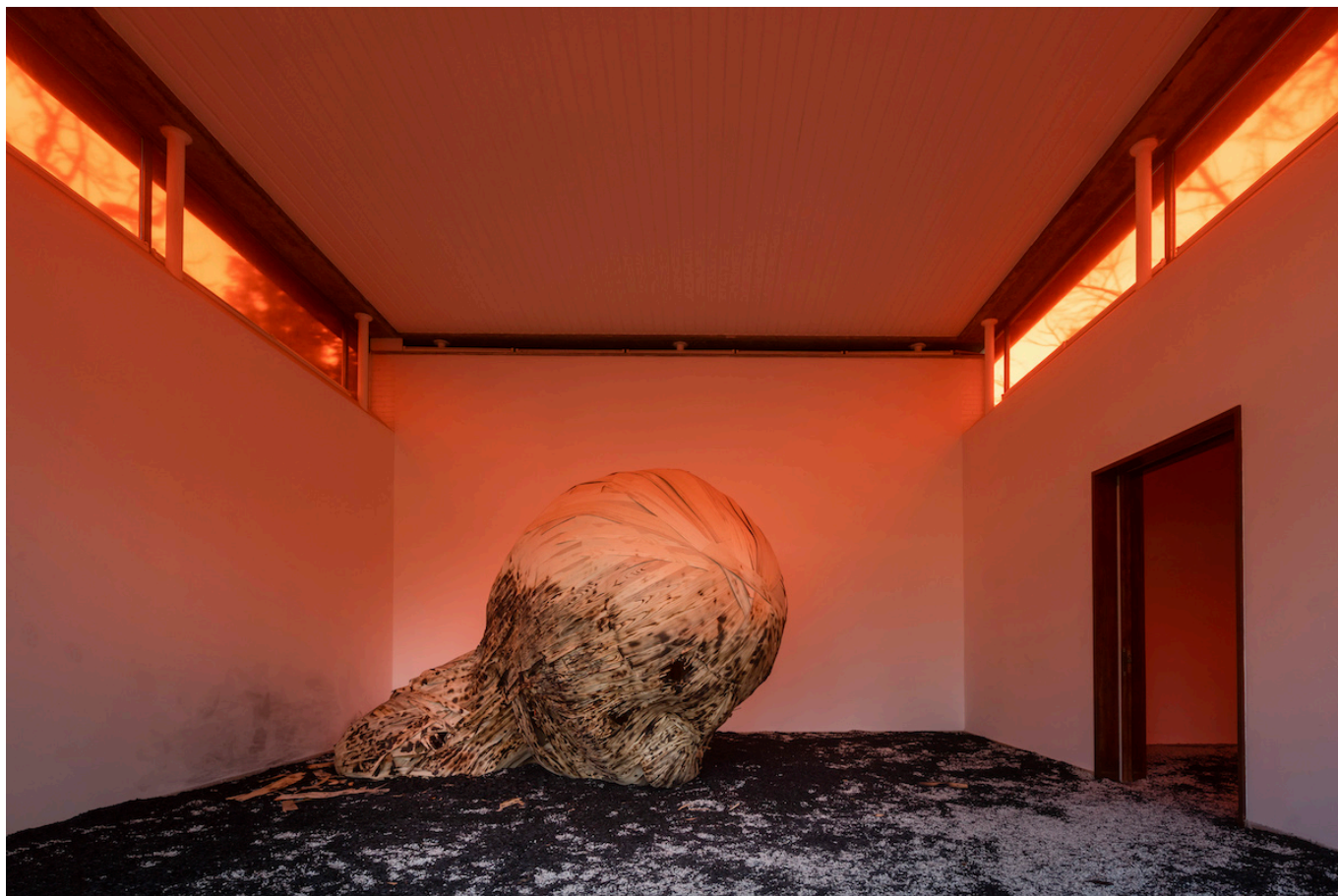
Installation view of The Concert by Latifa Echakhch, Swiss Pavilion at the 59th International Art Exhibition – La Biennale di Venezia, 2022.

цюрихской площади Sechseläutenplatz во время праздника в честь окончания зимы. Таким образом, в неумолимом колесе времени огонь представляет собой одновременно начало и конец. В этих работах несложно увидеть отсылку к круговороту жизни: Латифа Эшакш затрагивает фундаментальную и глубоко человеческую тему рождения, кульминации и быстротечности всего сущего. Проход по комнатам можно сравнить с катарсисом, и, в целом, те, кто ищет тишины среди суеты, найдут ее в швейцарском павильоне.