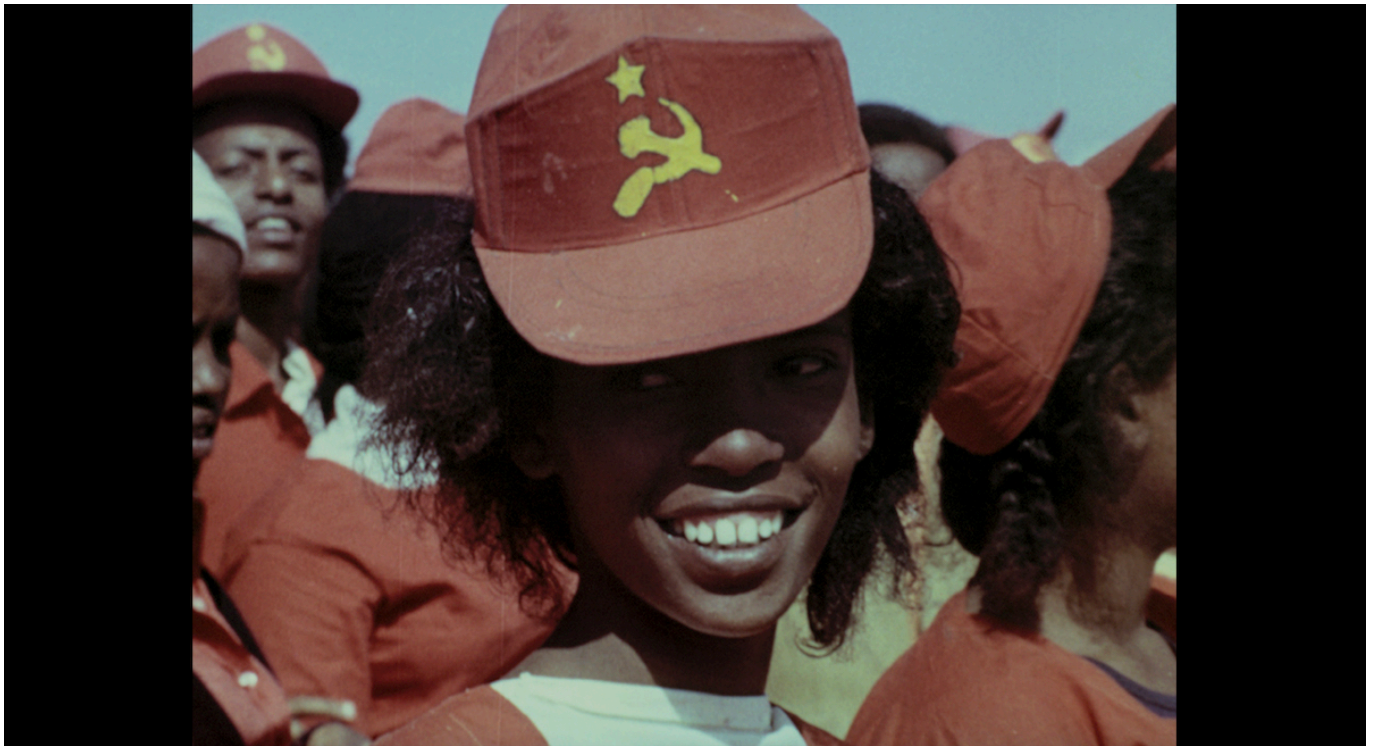
Кадр из фильма «Красная Африка».

«рая». Фильм будет показан 11 и 13 апреля.