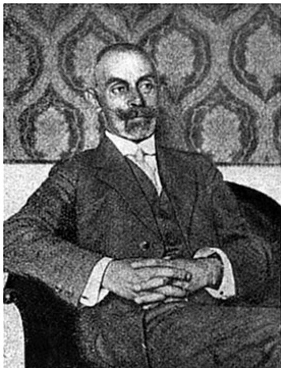
Е. К. Лукасевич

Большинство приведённой в данной статье информации взято из материалов Миссии Украинской Народной Республики (УНР) в Швейцарии. Напомним в двух словах, что УНР существовала в 1917–1920 годах, а ее правительство в изгнании – до 1992 года, когда было официально признано правопреемство этого государства и современной Украины. Автор сразу оговаривает, что настоящая статья посвящена вовсе не истории украинской государственности, а другим вопросам, поэтому многие исторические детали в данном тексте опускаются.