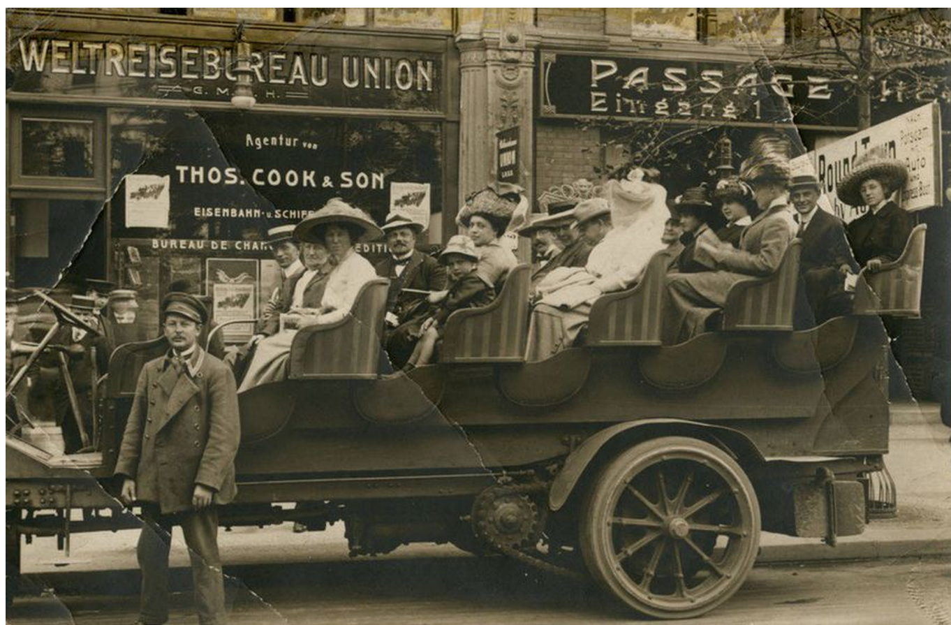
Туристы перед агентством Томаса Кука

Auteur: Наталья Беглова, Женева , 24.12.2021.