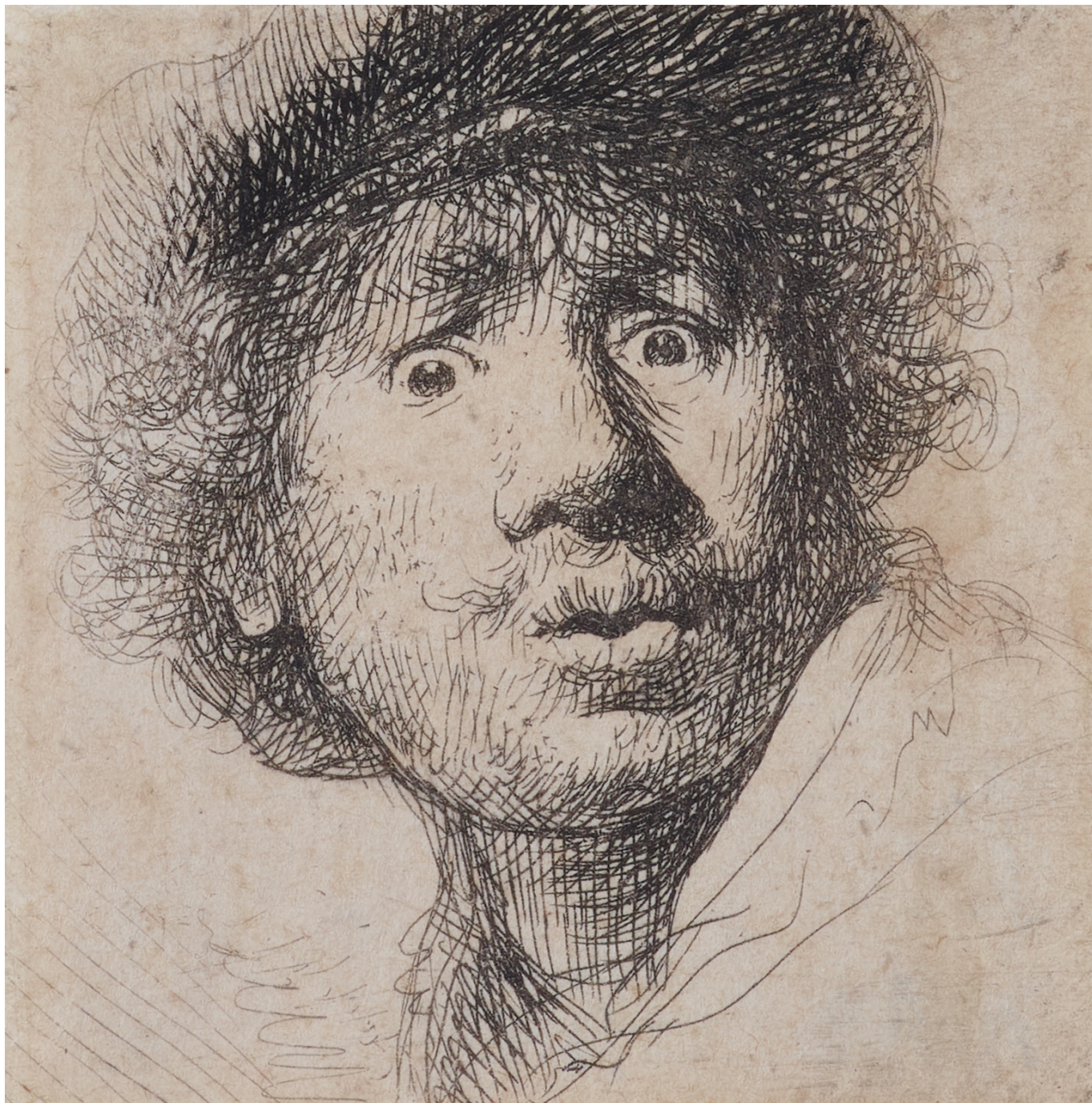
Рембрандт (1606 - 1669), "Голова мужчины в берете", или Рембрандт с дикими глазами, 1630 г. Musée Jenisch Vevey - Cabinet cantonal des estampes, Collection du Musée Alexis Forel