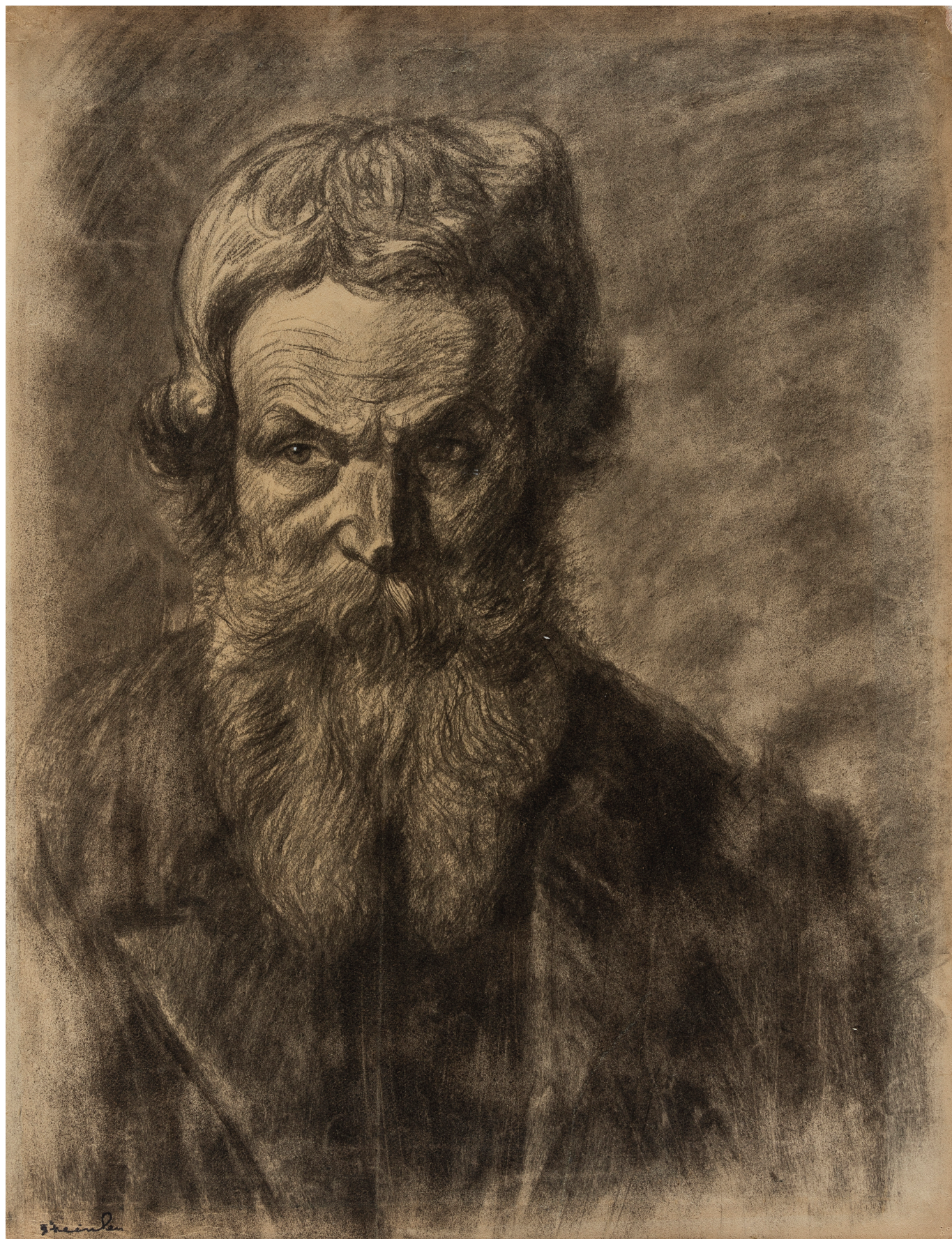
Теофил Александр Стейнлен, "Портрет Льва Толстого", ок. 1905 г., Musée Jenisch Vevey

ощущение полного погружения в контекст и вызывает непреодолимое желание бросить все и бежать смотреть – но уже не «просто так», а со смыслом, обращая внимание на детали, которые могли бы остаться незамеченными.