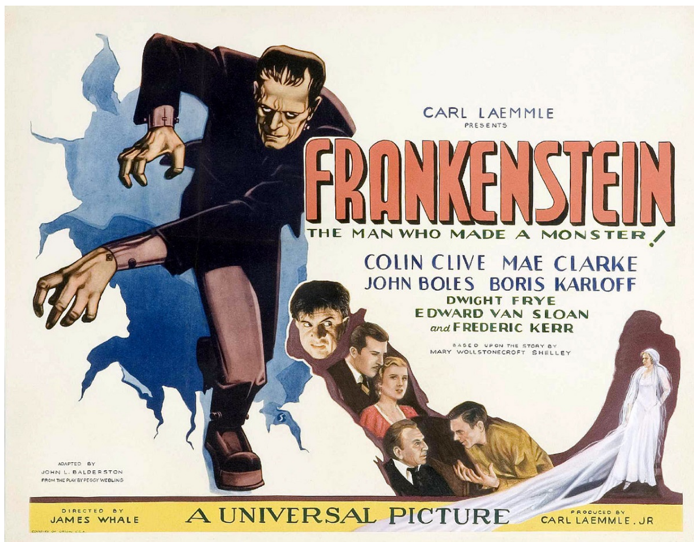
Постер фильма «Франкенштейн»

Auteur: Заррина Салимова, Женева , 28.06.2021.