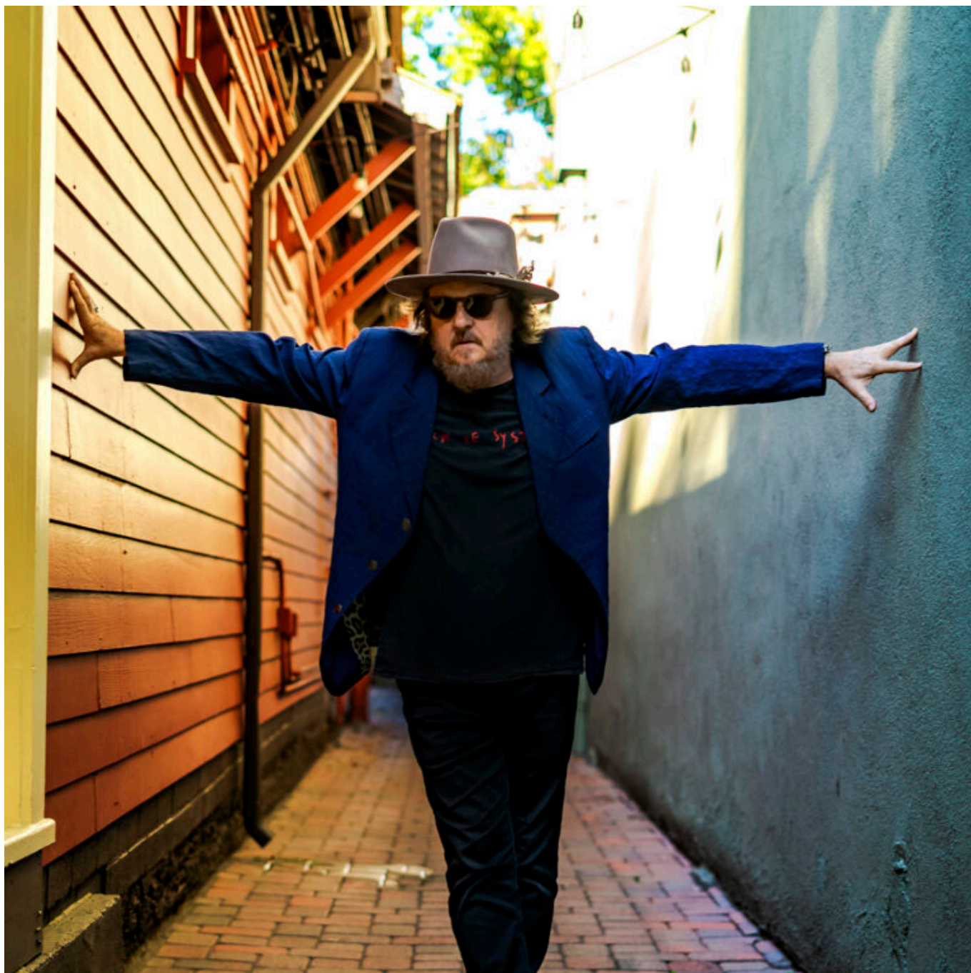
Неподражаемый Дзуккерио

Напомним, что многих из включенных в программу музыкантов связывают долгие дружеские отношения с Montreux Jazz Festival. Так, именно в Монтрё в 2017 году Ибрагима Маалуфа заметил легендарный продюсер Куинси Джонс. А Дзуккерио выступит на фестивале уже в четвертый раз: поклонники творчества автора хита Senza Una Donna, наверняка, помнят, как он «зажег» зал на концерте в Монтрё в 2018 году. В свои шестьдесят пять лет и с шестьюдесятью миллионами проданных альбомов, итальянец, несомненно, является одним из ведущих исполнителей блюз-рока в мире.