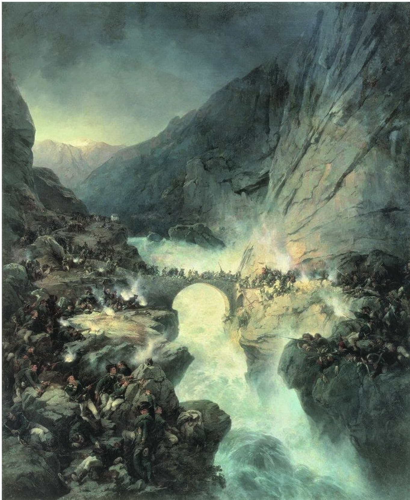
А.Е. Коцебу. Переход русских войск через Чёртов мост в 1799 году. 1857 г. Государственный Эрмитаж, Санкт-Петербург

Действительно: если исходить из того, что Суриков ставил задачу поведать об успехе операции, о героизме солдат, об их беззаветной вере в своего полководца, а не о драматическом развитии событий, тогда всё становится на свои места. Однако есть картина другого российского художника-баталиста, Александра Евстафиевича Коцебу (1815–1889), запечатлевшая ту же сцену, которая, вероятно, лучше передаёт то, что на самом деле происходило тогда в Альпах.