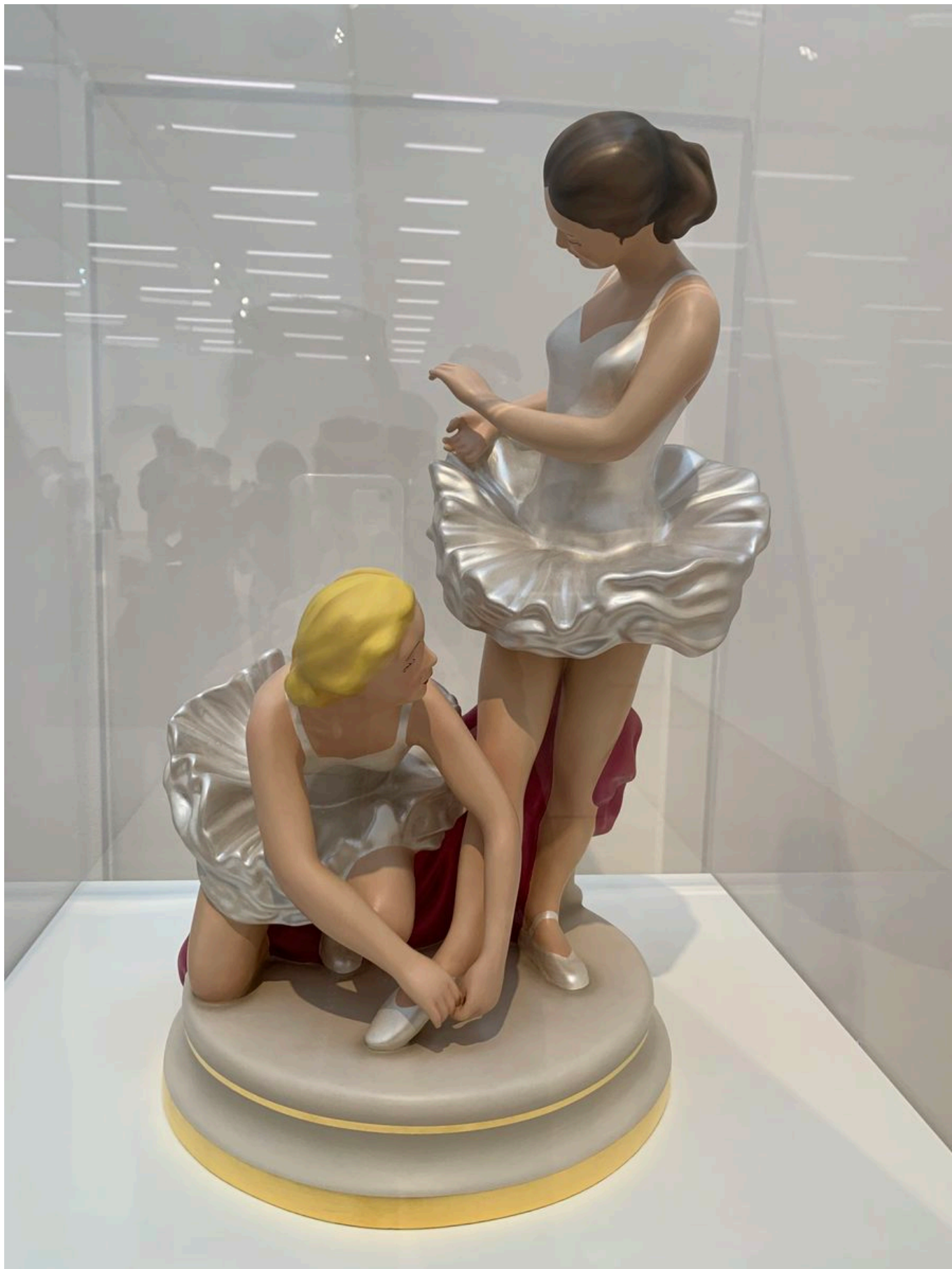
Джефф Кунс. "Балерины", 2017 г. Частная коллекция.

В первом, «Уловить движения», представлены творения Эдгара Дега: одна из его знаменитых «Танцовщиц», вдохновленная балеринами Парижской оперы, «перекликается» с «Балеринами» Джеффа Кунса, навеянными фарфоровыми