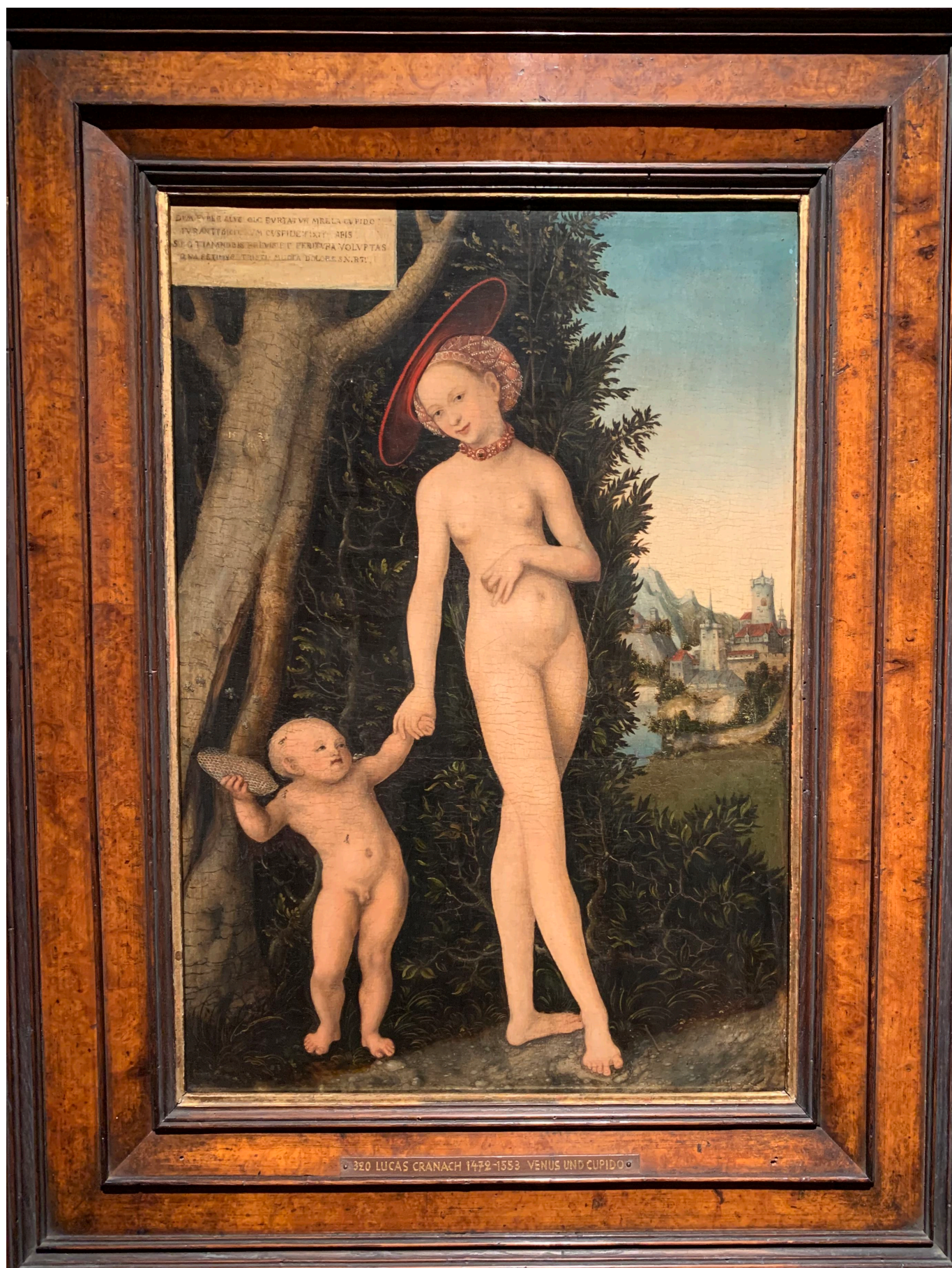
Лукас Кранех Старший. Венера и Амур, ворующий мёд, 1531 г. ((Toulouse, Fondation Bemberg)

Венера и Амур были частыми «гостями» его полотен, одно из которых, созданное в 1509 году, хранится в Государственном Эрмитаже в Санкт-Петербурге. Работа,