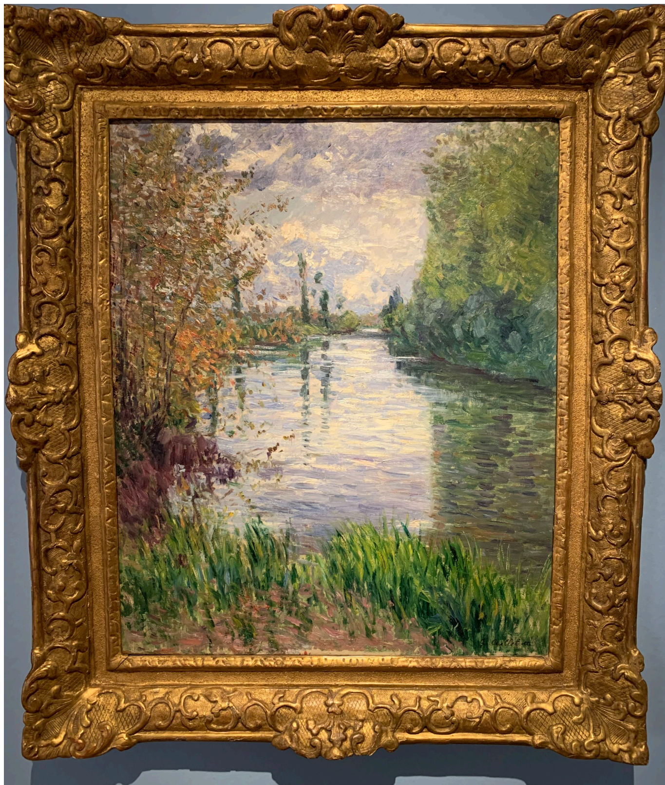
Густав Кайботт (1848-1894). Приток Сены осенью, ок. 1890 г. (Toulouse Fondation Bemberg)