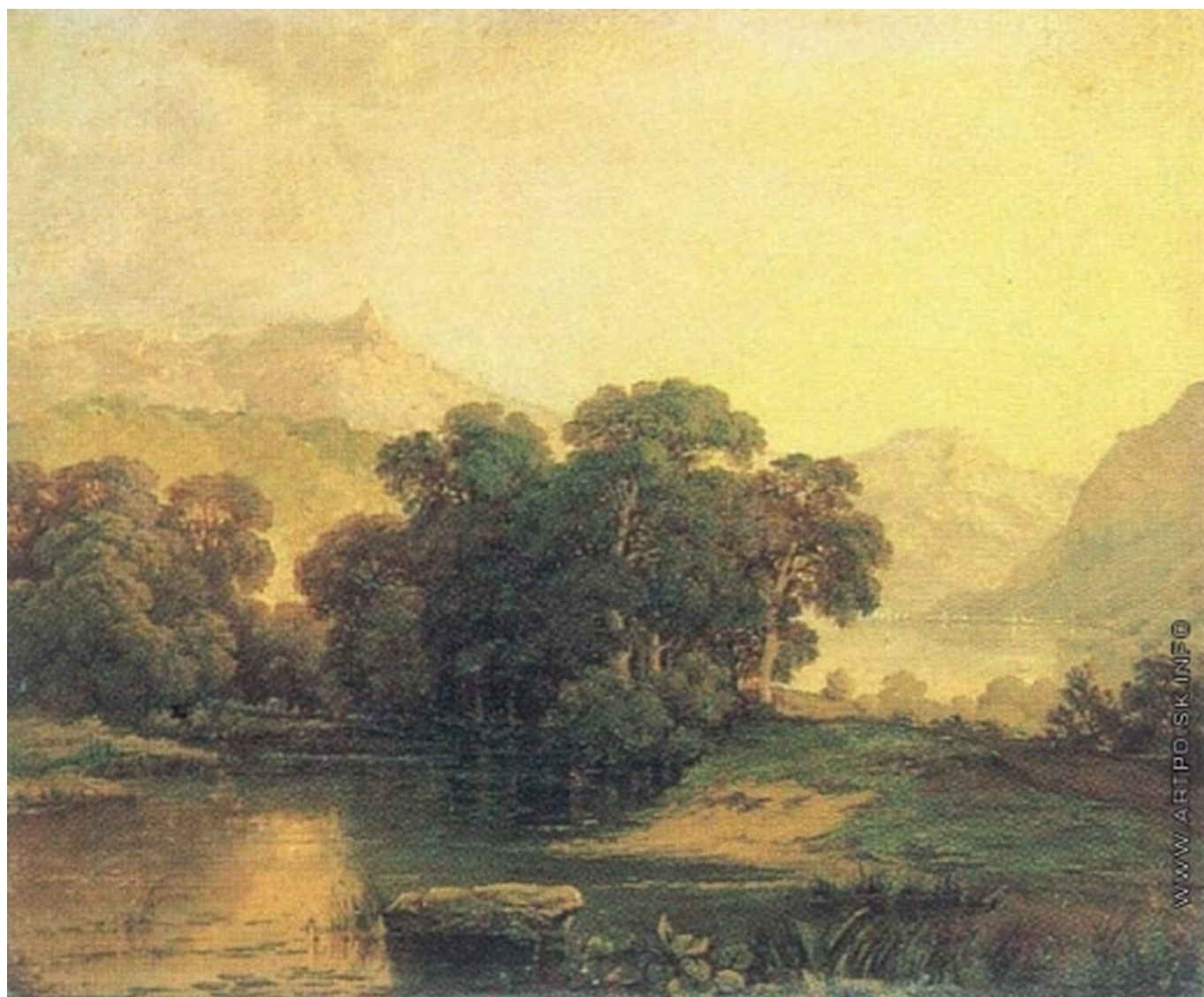
Воробьев М. Н. Швейцарский пейзаж, ок. 1845 г. Государственный Русский музей, Санкт-Петербург

Выдающийся русский живописец Максим Никифорович Воробьев (1787-1855) занимал значительное место в истории русского искусства и как наставник целого поколения русских пейзажистов. В течение сорока лет он преподавал живопись в Императорской Академии художеств Петербурга, среди его учеников был, например, И. К. Айвазовский.