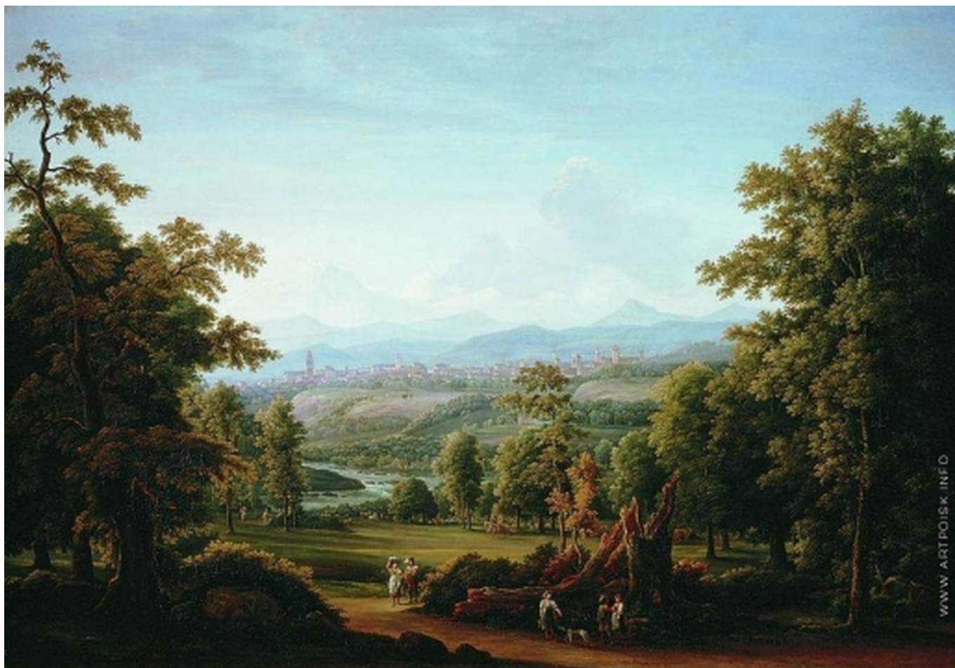
Матвеев Ф.М. Вид в окрестностях Берна, 1817 г. Государственный Русский музей, Санкт-Петербург.

Auteur: Наталья Беглова, Женева , 02.04.2021.