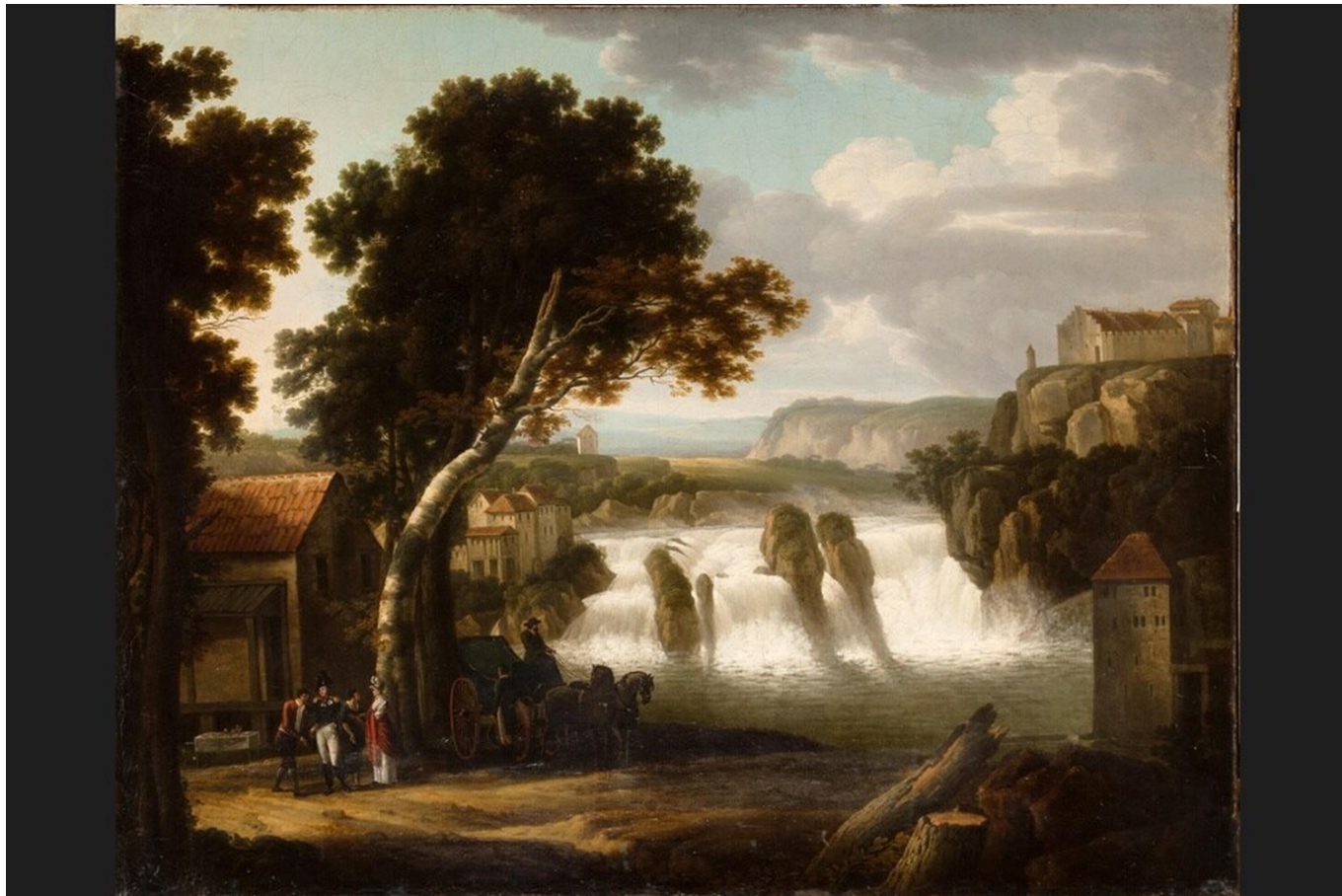
Щедрин С.Ф. Александр I у Шафгаузенского водопада, 1814 г. Государственный Русский музей, Санкт-Петербург.

В очерке «Братья Дюваль. Швейцарские ювелиры в России. Часть II. Женевские приключения Ореста Кипренского» мы подробно рассказывали о том, как знаменитый русский художник оказался в Швейцарии. Так что не будем повторяться, а упомянем лишь о том, что несколько работ Кипренского, ставшего первым и последним русским художником, удостоенным звания почетного члена женевского Общества изящных искусств, были переданы в дар Публичной библиотеке Женевы, где ими можно полюбоваться и сегодня.