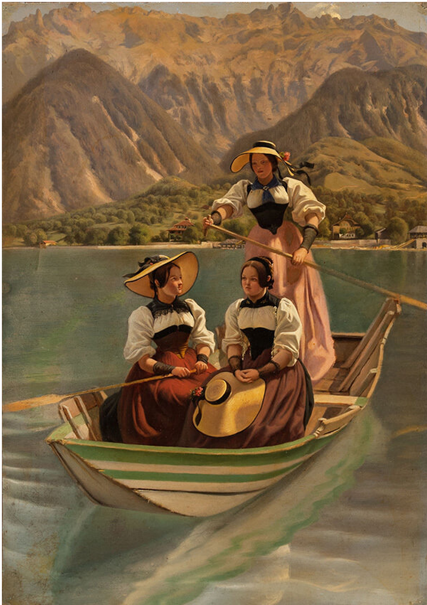
Рейтерн Е.Р. Три швейцарские крестьянки в лодке на Бриенцком озере, 1849 г.