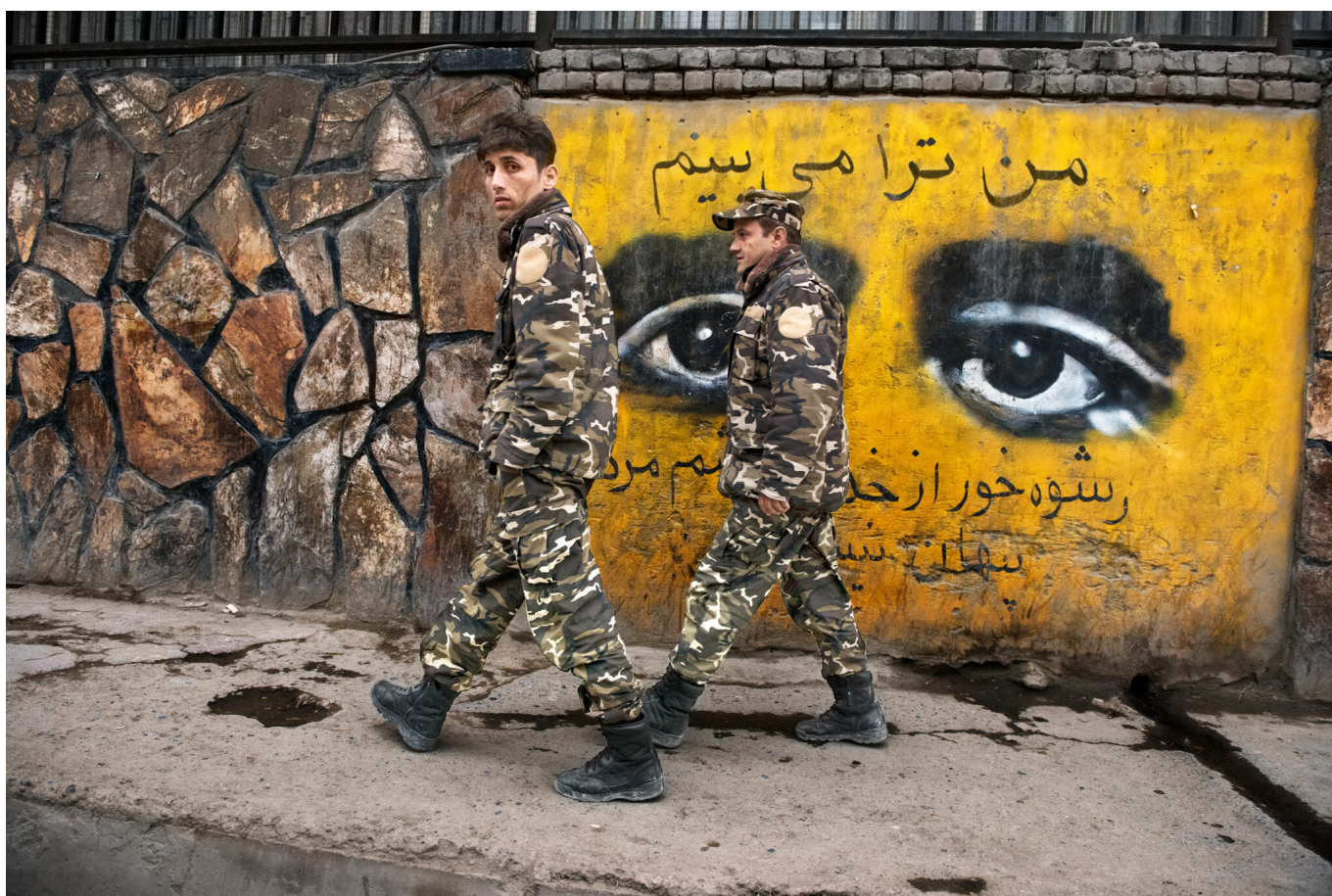
Musée Barbier-Mueller.