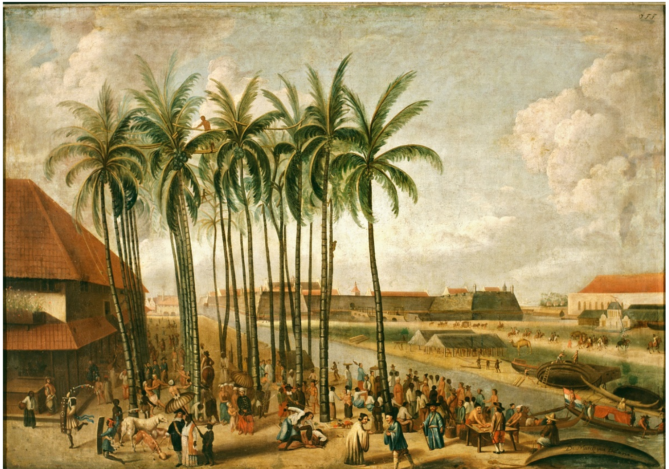
«Der Markt von Batavia», J. F. F. nach Andries Beeckman, nach 1688 Coll.no. TM-118-167

Истины в этих полотнах, на самом деле, не так и много. Живописные изображения, посвященные, например, теме торговли, по большей части не были ни реалистичными, ни документальными. Художники не претендовали на то, чтобы точно изобразить повседневную сцену или историческое событие, а некоторые отличались «потребительским» отношением и поверхностным подходом, ограничиваясь заимствованием понравившихся экзотических вещей, например, расшитых халатов, мягких туфель с кисточками или посуды, и их интеграцией в повседневную жизнь. Библейские сцены со скалами, пальмами, мужчинами в тюрбанах и женщинами в ярких одеждах и вовсе основаны на фантазиях, так как очень немногие голландцы сами видели эти места и имели представление о тех реалиях. Восток для них был абстрактной идеей и чем-то противоположным рационалистическому Западу. В целом, многие картины только укрепляли существовавшие тогда клише, но, тем не менее, живописцы, противопоставляя привычную им среду Востоку, внесли большой вклад в возникновение и определение понятия европейской идентичности.