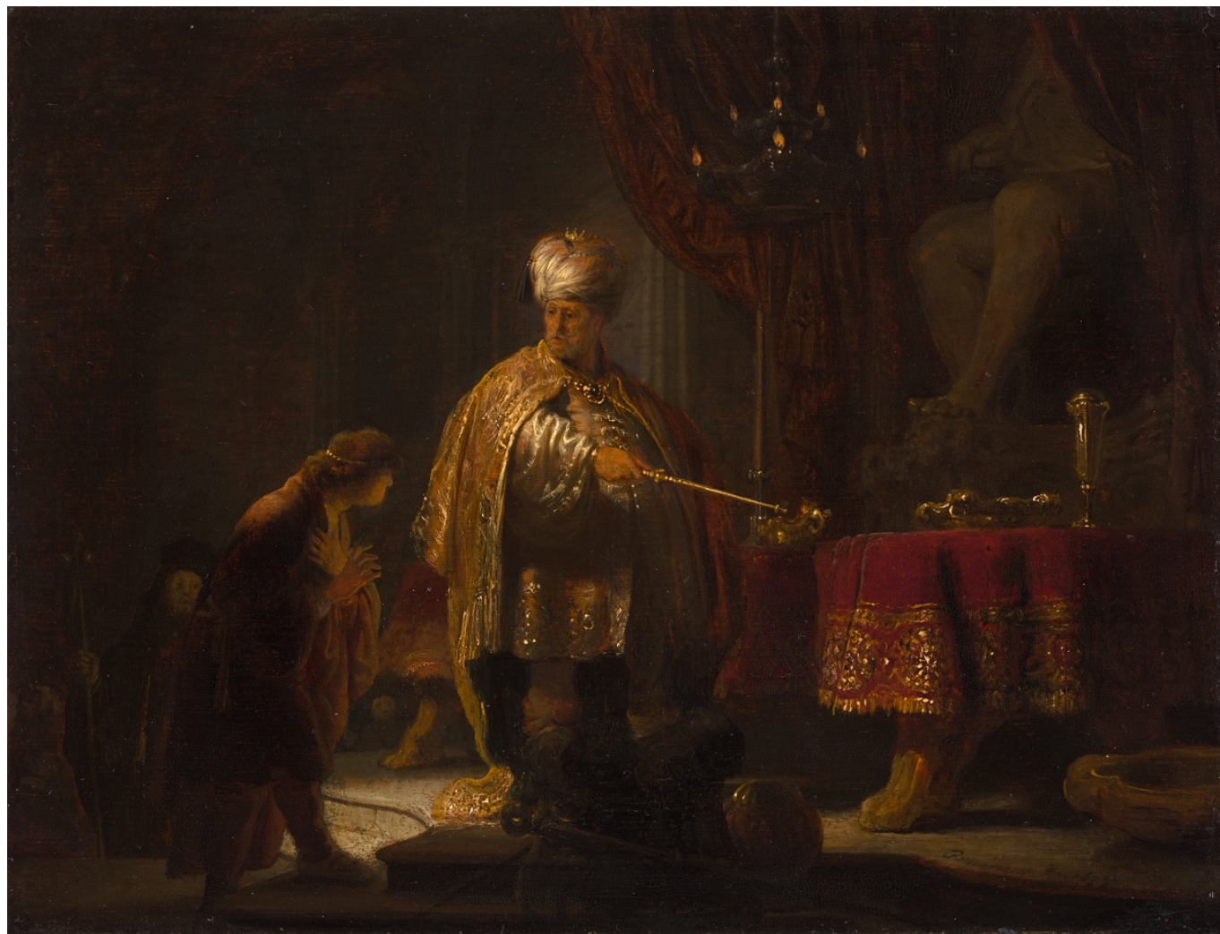
«Daniel und Cyrus vor dem Götzenbild des Bel», Rembrandt Harmensz van Rijn, 1633

Если в Романдии из-за противоэпидемических ограничений культурная и социальная жизнь поставлены на паузу, то в некоторых немецкоязычных кантонах Конфедерации музеи (пока) открыты. В Кунстмузеуме Базеля, например, сейчас проходит одна из главных выставок сезона – «Восток Рембрандта».