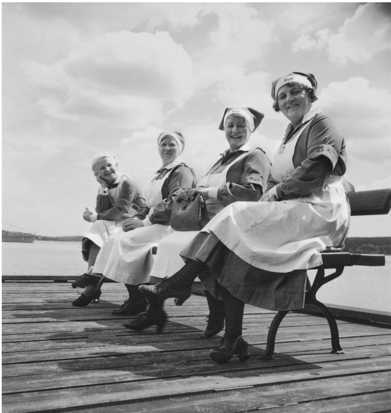
Медсестры у озера рядом с замком Грипсхолм, Марифред, Швеция, 1937.

Выставка в Центре Пауля Клее строится вокруг фоторабот, сделанных Аннемари в период с 1933 по 1942 годы во время ее поездок по Ближнему Востоку, Средней Азии, США, Европе, Центральной и Северной Африке. Многие снимки дополнены выдержками из ее текстов и писем и представляют собой ценнейшие задокументированные свидетельства разрушающегося накануне Второй мировой войны мира. От камеры Аннемари не ускользнули ни последствия экономического кризиса 1929 года в США, ни бедность, ни безработица, ни первые звоночки, свидетельствующие о наступлении фашизма, например, плакаты с изображением Гитлера и лозунгом «Один народ – один рейх – один фюрер» или национал-социалистские символы в окнах домов на улицах европейских городов.