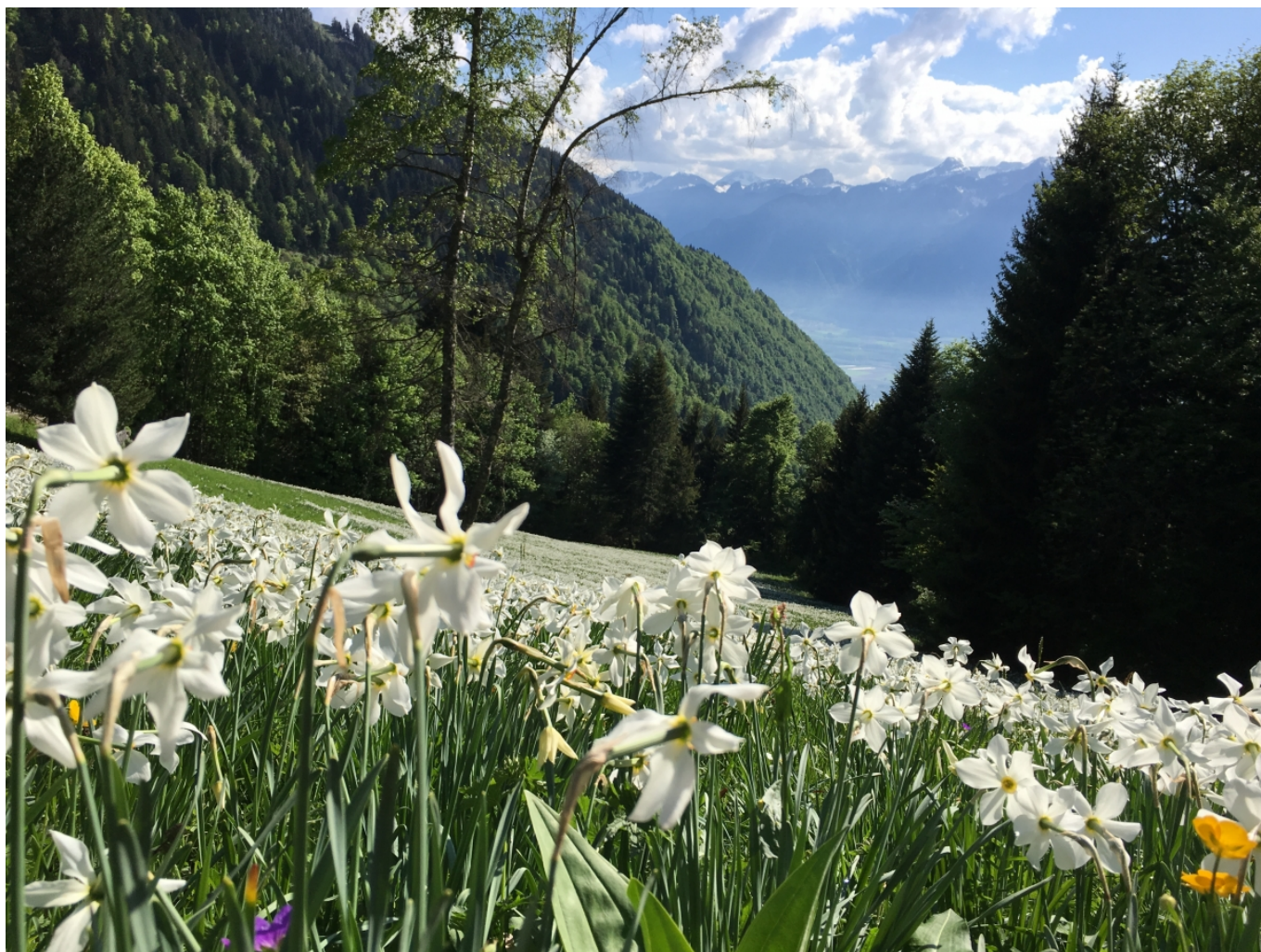
Поля нарциссов в районе Лез-Аван - «скверные луга для скотины».

Далее писатель признается, что не смог найти ответ на это вопрос и предпочел остаться в состоянии неопределенности, колебания, поскольку только это – «единственное справедливое жизненное чувство». В дальнейшем в произведениях Толстого мы никогда не увидим однозначной оценки событий или людей, мы не встретим стопроцентных негодяев или безупречных героев. А его главные персонажи, вечно раздираемые противоречиями, ищущие и не находящие однозначных решений, будут, как и сам автор, «довольствоваться гармоническим колебанием», классический пример тому Пьер Безухов.