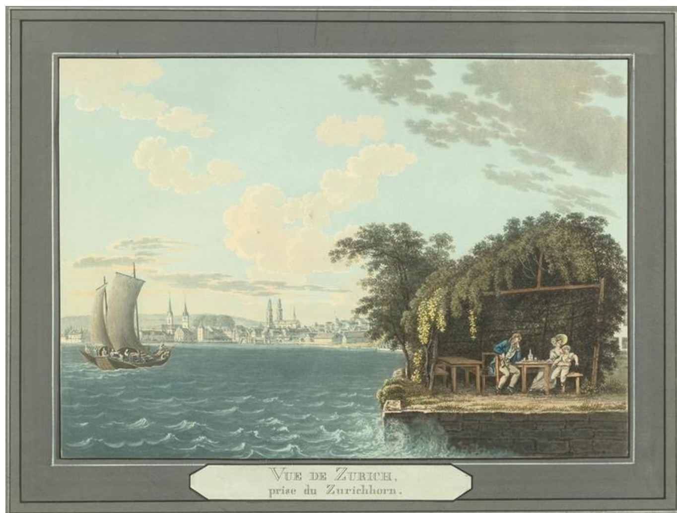
Цюрих – родина Песталоцци. Старинная акварель.

Неудача не сломила Песталоцци, он нашел другую возможность служить делу, которому решил посвятить жизнь. На протяжении последующих восемнадцати лет он пишет книги, посвященные проблемам воспитания и обучения детей. О чем же они? Главная его мысль – образование нужно всем и является фундаментальным правом людей, рожденных равными. Песталоцци идет еще дальше в своих размышлениях, заявляя, что именно во всеобщем образовании залог процветания государства. По его мнению, никакие прогрессивные реформы не утвердятся, если они не будут поддержаны народом, если все население не будет понимать их значения и важности.